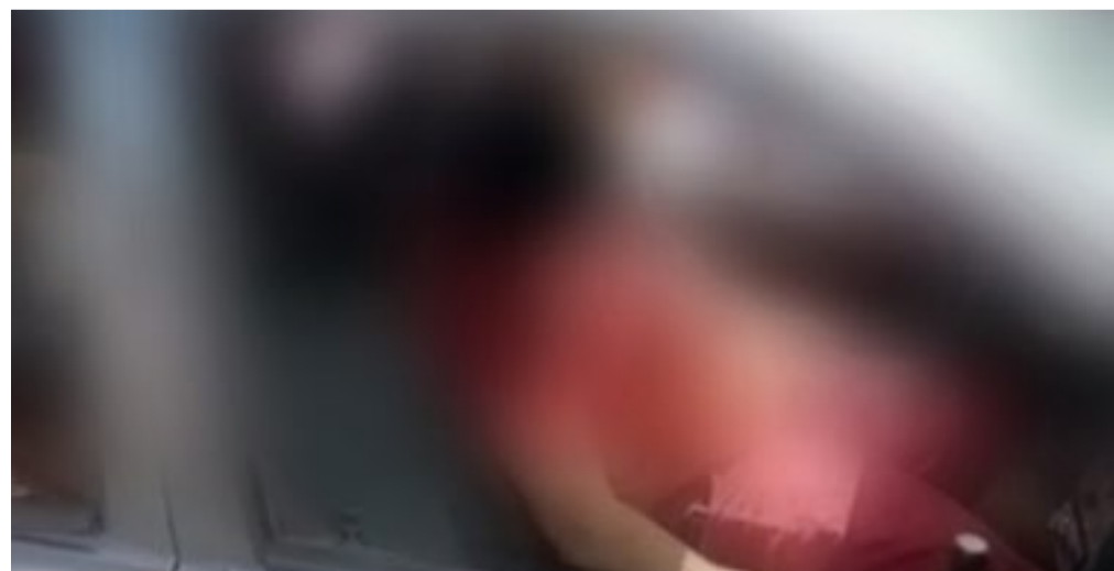
O feirante voltava para casa, quando foi abordado pelos suspeitos.

A Polícia Militar foi notificada e isolou o local até a chegada dos peritos do Instituto de Criminalística (Icrim). O corpo da vítima foi encaminhado para o Instituto Médico Legal (IML), no Itaqui-Bacanga, onde será examinado.