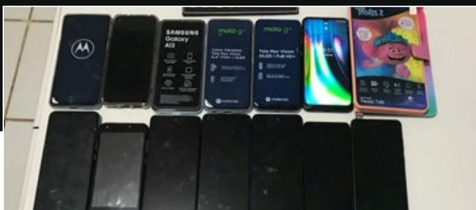
Celulares recuperados pela Polícia Militar na capital.

No Maranhão foram roubados ou furtados 22.804 aparelhos celulares durante o ano de 2021, segundo o Anuário de Segurança Pública, que se baseia em informações fornecidas pelas secretarias de segurança pública dos estados do Brasil, pelas polícias civis, militares e federal, entre outras fontes oficiais da área de segurança.