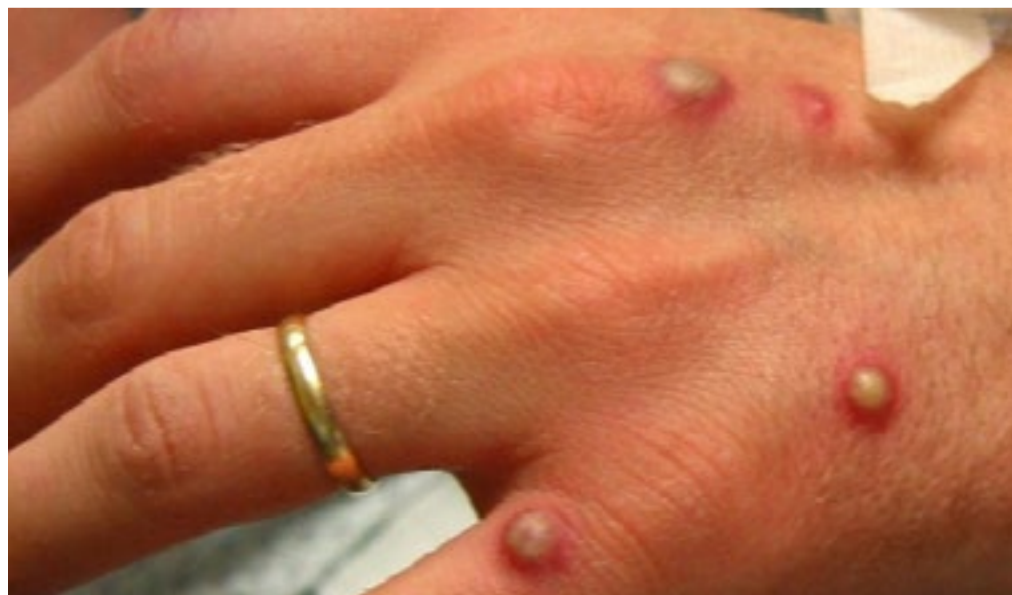
Maioria dos casos foi registrada em São Paulo

Trata-se de uma doença viral rara transmitida pelo contato próximo com uma pessoa infectada e com lesões de pele. O contato pode ser por abraço, beijo, massagens ou relações sexuais. A doença também é transmitida por secreções respiratórias e pelo contato com objetos, tecidos (roupas, roupas de cama ou toalhas) e superfícies utilizadas pelo doente.