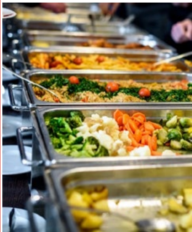
Aumento no preço da refeição em São Luís corresponde a 41% em relação à última pesquisa, realizada em 2019

A região Sudeste, de acordo com o levantamento, foi a que teve o maior preço médio no almoço, de R$ 42,83. O almoço mais barato por região foi encontrado no Centro-Oeste, com R$ 34,20, onde ficou também a capital com o valor mais baixo: Goiânia com R$ 27,94.