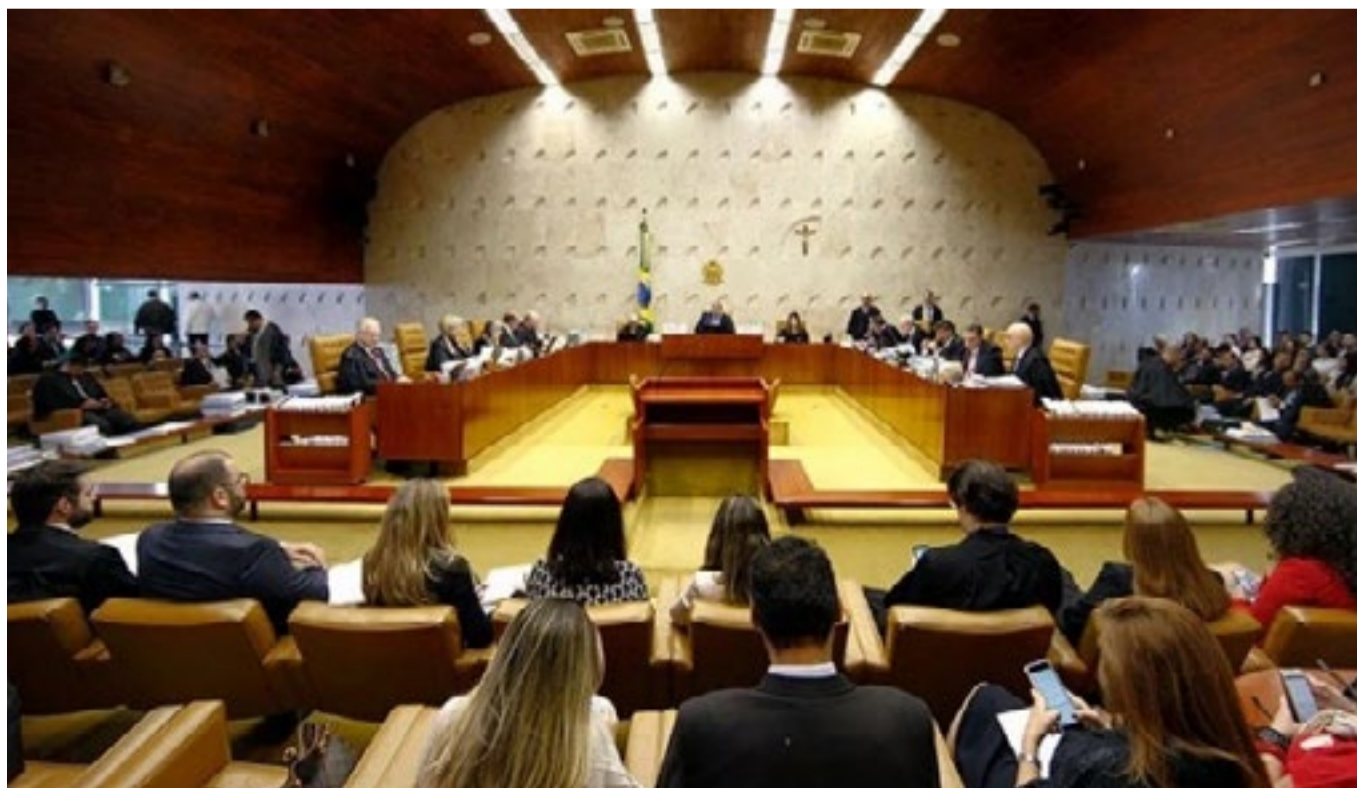
Ministros do STF vetaram aumento de gastos com publicidade

estaduais e municipais em ano eleitoral não podem ser aplicadas antes do pleito eleitoral deste ano. Na sessão virtual encerrada em 1º/7, o Plenário deferiu