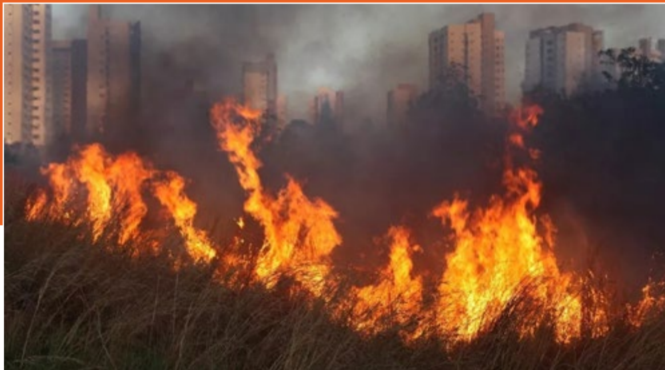
Os dados foram divulgados pelo INPE

De acordo com o Instituto Nacional de Pesquisas Espaciais (INPE) o Maranhão já registrou, até o momento, 2.029 focos de incêndio em todo o estado. Os dados foram captados por meio de satélites de referência.