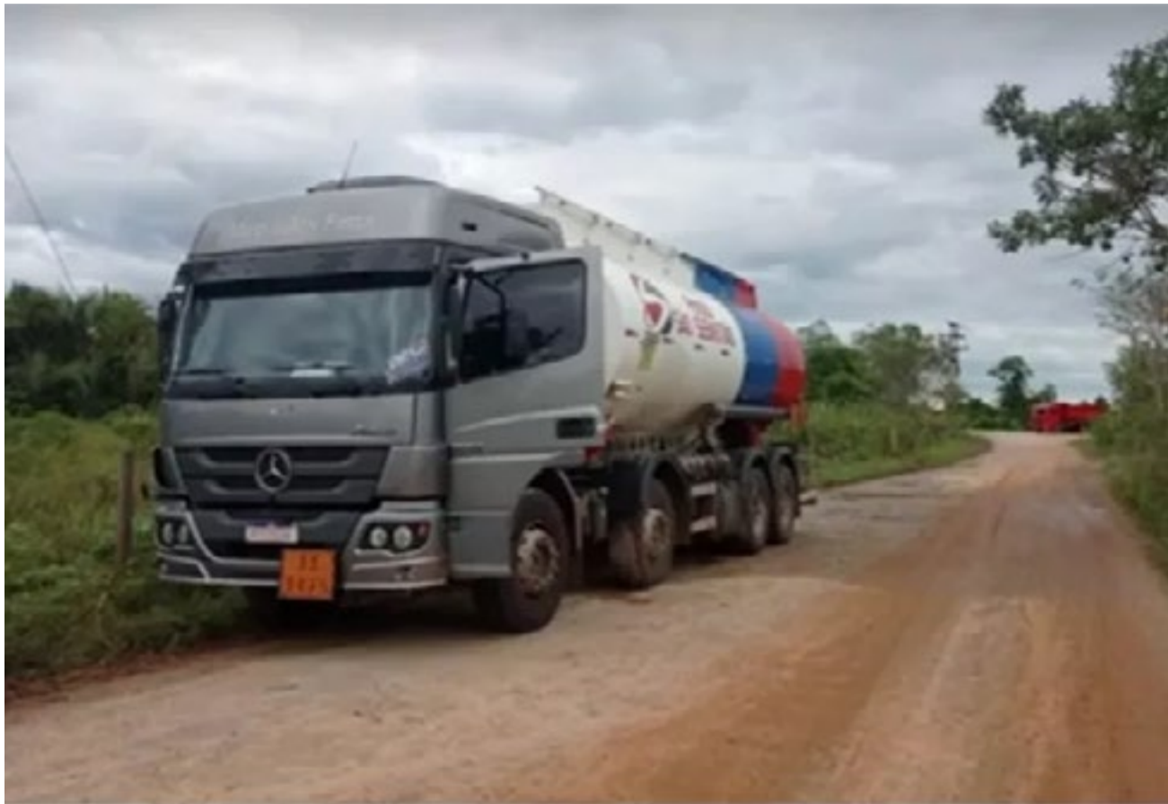
Caminhão com cerca de 25 mil litros de combustível é roubado na BR-222, no Maranhão

Até o momento nenhum suspeito foi preso nem identificado. O caso está sendo investigado pela Polícia Civil do Maranhão.