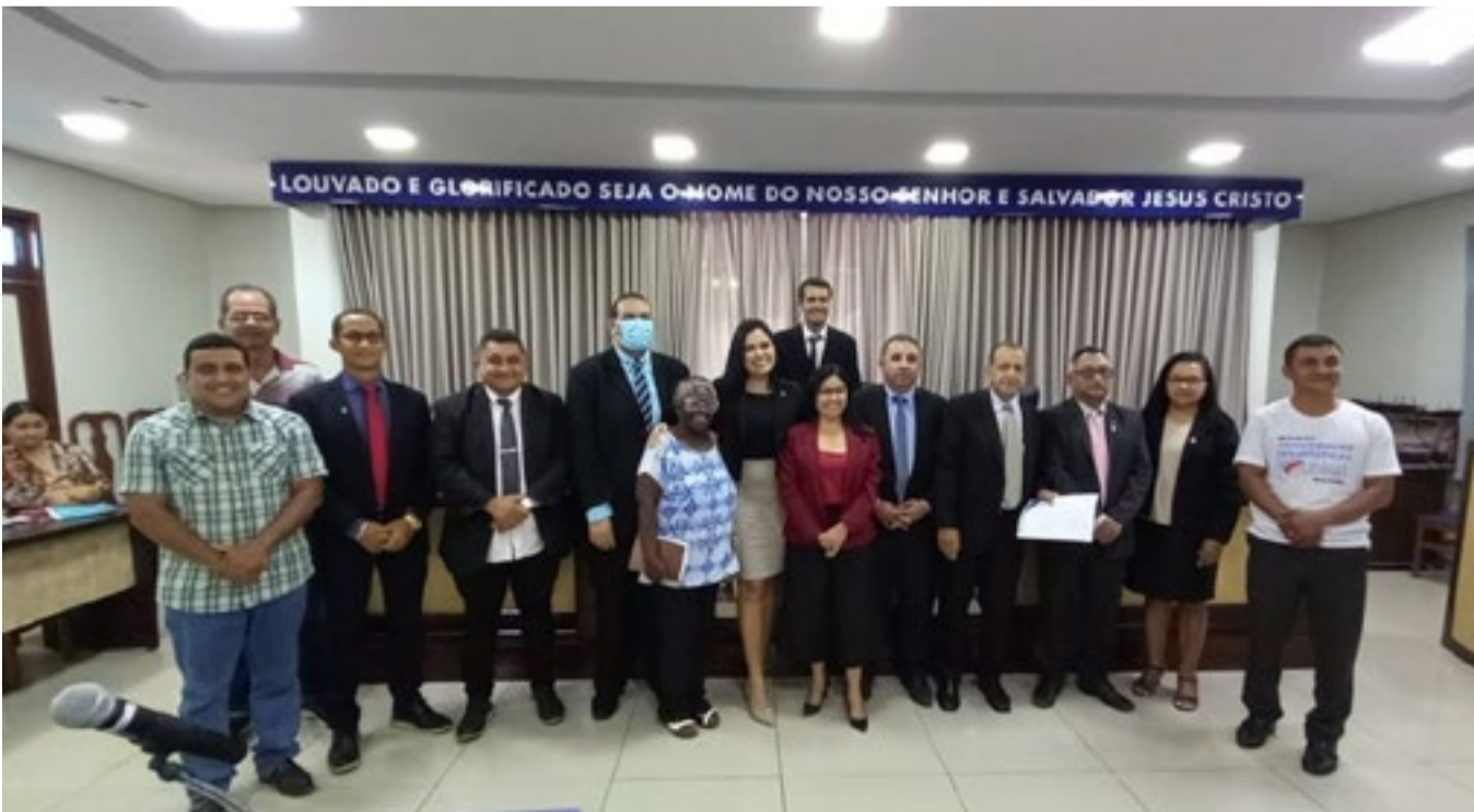
NA PAUTA, FORAM APROVADOS PROJETOS DE LEI E ALTERAÇÃO EM LEI