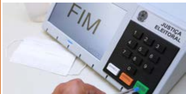
Primeiro turno das eleições ocorre dia 2 de outubro.

O eleitorado brasileiro cresceu 6,21% em relação ao pleito de 2018, quando o total de pessoas aptas a votar foi de 147,3 milhões.