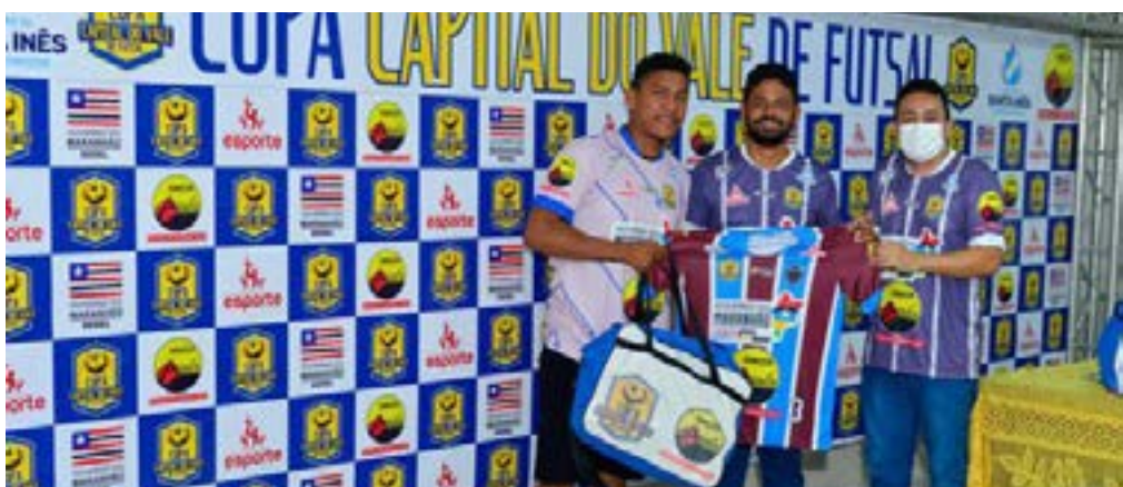
Nesta primeira edição, as disputas da Taça Santa Inês ocorrerão nas categorias Sub-13 e Sub-15.