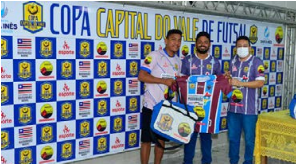
Nesta edição, A Copa Capital do Vale de Futsal contará com a participação de 16 times.