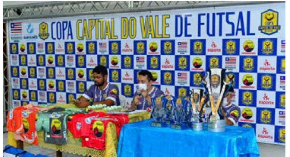
Ao final das disputas haverá a premiação dos times campeões e vice-campeões com troféus e medalhas.

Vem aí a primeira edição da Copa Capital do Vale de Futsal Adulto Masculino, competição que conta com os patrocínios do governo do Estado e do Armazém Paraíba por meio da Lei Estadual de Incentivo ao Esporte e com o apoio da Prefeitura de Santa Inês. O lançamento oficial do torneio ocorreu na noite de segunda-feira (11), no auditório da Secretaria Municipal de Educação (Semed), em Santa Inês, com a presença dos representantes das equipes participantes.