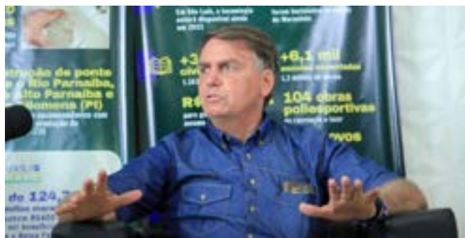
Bolsonaro concedeu entrevista em São Luís

O presidente da República, Jair Bolsonaro (PL), cobrou em entrevista coletiva concedida na tarde desta quinta-feira em São Luís, unidade de grupo que atua no seu campo político para a disputa das eleições 2022 no Maranhão.