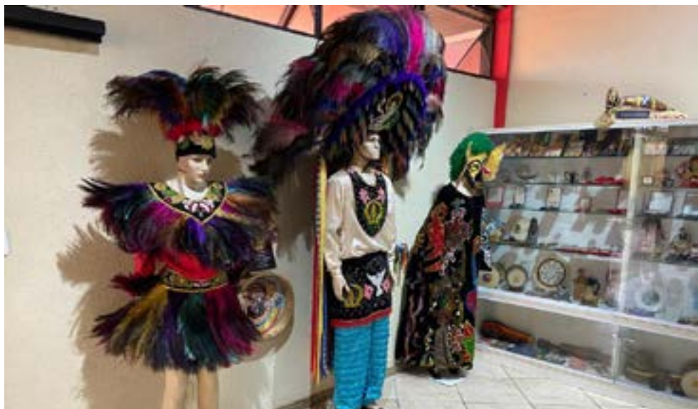
Haverá também a exibição da exposição “Ponto de Luz

Além da exposição e do espetáculo “Maranhão de Festejos” (com quadros tradicionais representativos do bumba meu boi, do tambor de crioula, das danças juninas do Bozinho Barrica e das folias carnavalescas do Bicho Terra), a comunidade poderá participar das oficinas recreativas, com ênfase nas danças típicas do bumba meu boi, da quadrilha, do tambor de crioula e, também, nas folias carnavalescas. A entrada para toda a programação nas duas cidades será gratuita.