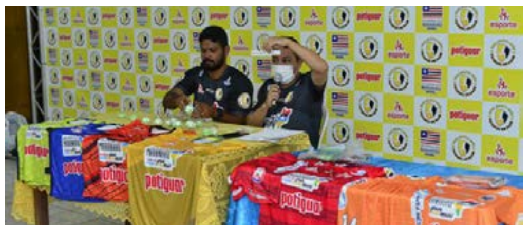
Durante o lançamento, a organização da competição realizou, ainda, os congressos técnicos dos torneios para definir os duelos de quartas de final.