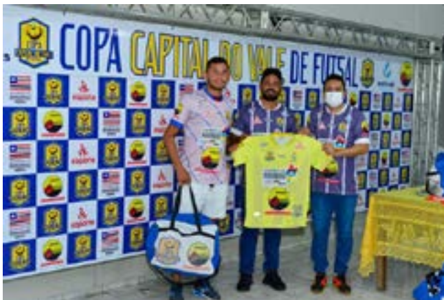
Ao todo, cerca de 200 atletas deverão disputar a competição.

Em sua primeira edição, a Copa Capital do Vale será disputada em formato de mata-mata com jogos de ida e volta. Durante o lançamento da competição, foram definidos os confrontos das oitavas de final: Palmeirense x Angelim,