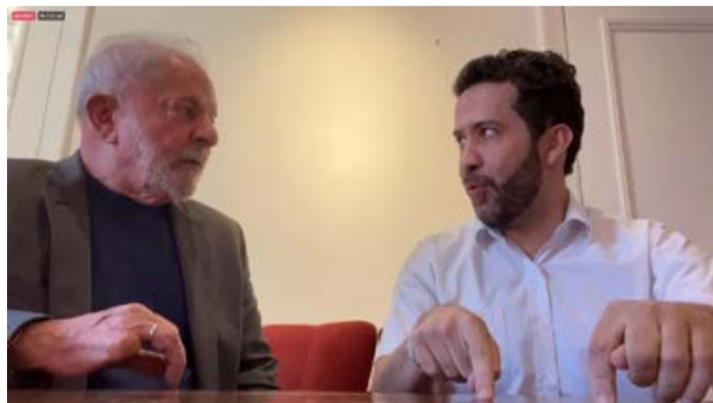
Janones e Lula se encontraram nesta quinta-feira (4) em São Paulo

Conquistar o apoio de Janones era um objetivo que a campanha de Lula havia traçado. Lula quer ganhar ainda no primeiro turno. Por isso, considera essenciais os votos que iriam para Janones. Também considera importante o fato de o deputado ser de Minas, o segundo maior colégio eleitoral do país.