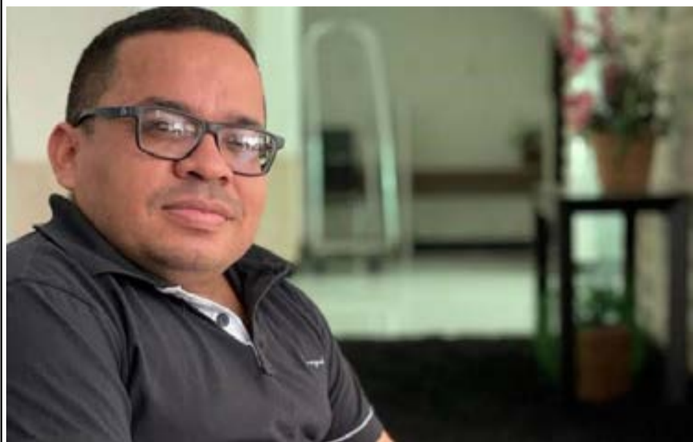
O cantor vai concorrer uma vaga pelo PL

Ainda de acordo com o Divulgaand, em seu registro de candidatura, Chicão declarou possuir um veículo avaliado em R$ 360 mil.