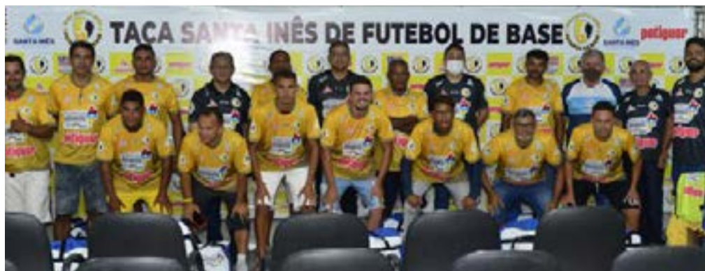
Quatro jogos vão movimentar a rodada de abertura dos torneios das categorias Sub-13 e Sub-15

No sábado (6) à tarde, a bola rola para dois jogos. Às 15h, Multi-ão e Atlético Pindareense se enfrentam pelo jogo de ida das quartas