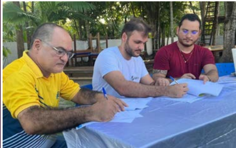
O convênio com a prefeitura prevê repasse de recursos do FUNDEB e transferência de recursos destinados a alimentação dos estudantes

A parceria é uma via de mão dupla. O Poder Público auxilia a instituição para que possa desenvolver os seus serviços e ofertar o ensino, garantindo o acesso à educação de qualidade. Essa assinatura significa fazer o bem a diversas famílias.