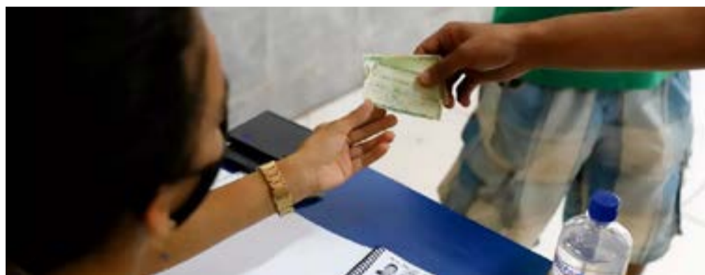
Eleitores vão às urnas no dia 2 de outubro para o 1º turno; caso preciso, 2º turno será no dia 30 do mesmo mês

Partidos e pré-candidatos se articulam para a eleição presidencial mais curta desde 1994. Neste ano, a campanha eleitoral será feita entre 16 de agosto e 1º de outubro, um período de 46 dias de ações nas ruas e internet.