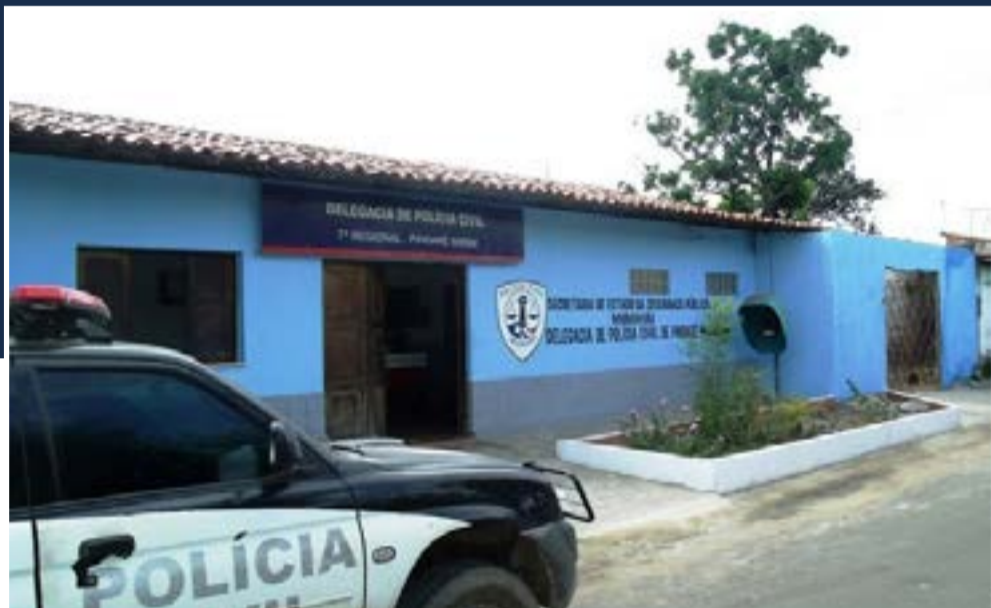
Delegacia de Pindaré Mirim