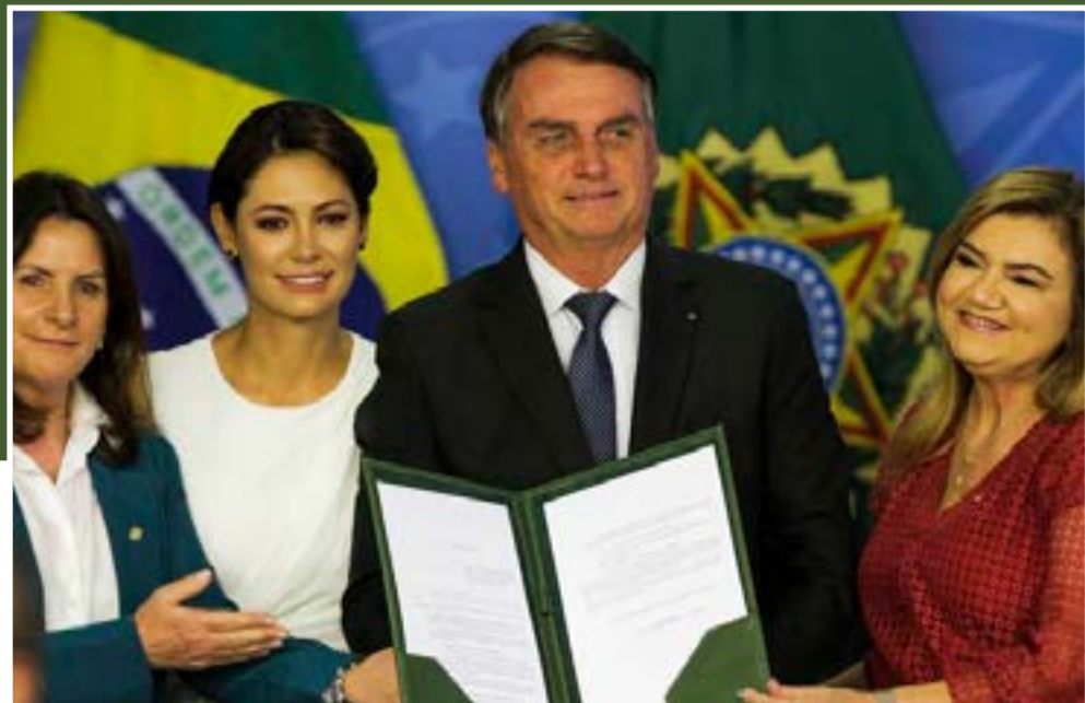
Presidente Jair Bolsonaro sancionou o projeto nesta quinta-feira, 04

O presidente Jair Bolsonaro sancionou, com um veto, a lei que fixa pisos salariais para enfermeiros, técnicos de enfermagem, auxiliares de enfermagem e parteiras. Segundo a Secretaria-Geral da Presidência, o ato será publicado nesta sexta-feira (5) no "Diário Oficial da União" (DOU).