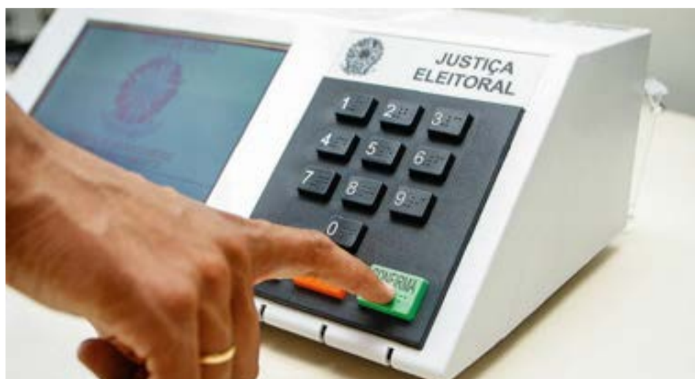
Com a simulada, o TRE também avaliará a votação na nova urna eletrônica