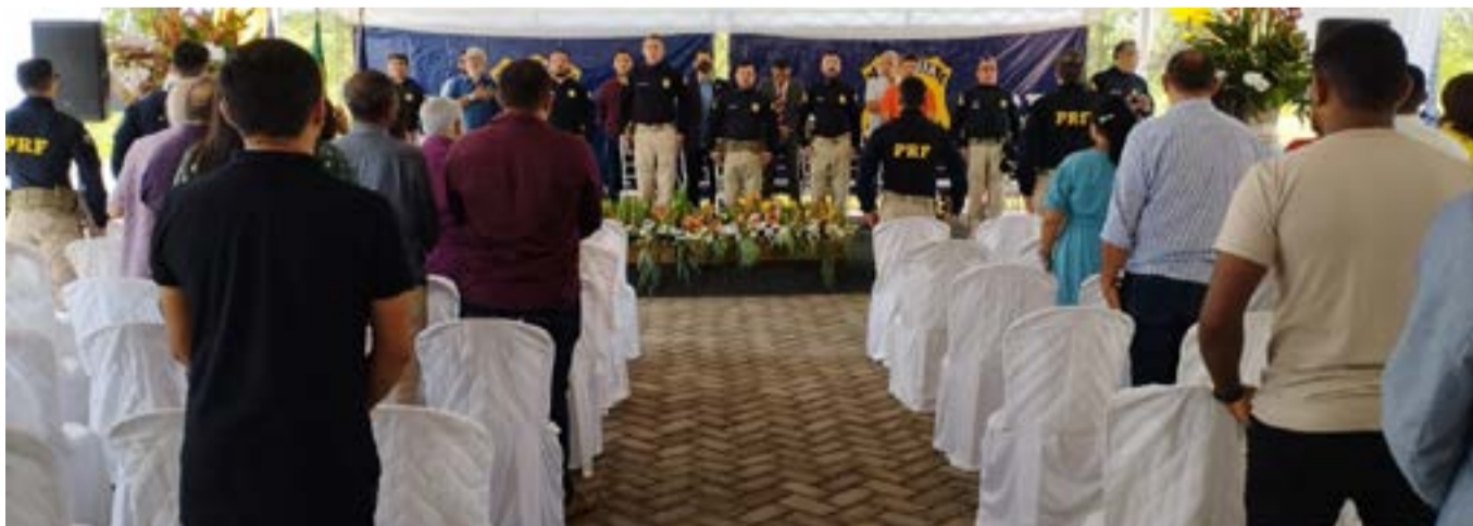
O evento de inauguração contou com a presença do Diretor-Geral, do Superintendente da PRF no MA, do Diretor de Administração e Logística, do Chefe da PRF em Santa Inês e autoridades locais