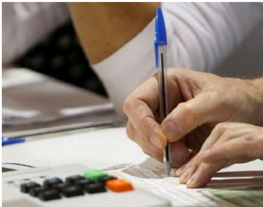
Requerimento para votar em trânsito precisa ser feito presencialmente

“O voto em trânsito funciona como uma transferência temporária de domicílio eleitoral. A habilitação para votar em trânsito não transfere ou altera quaisquer dados da inscrição eleitoral. Após as eleições, a vinculação do eleitor com a seção de origem é restabelecida automaticamente”, informa o TSE.