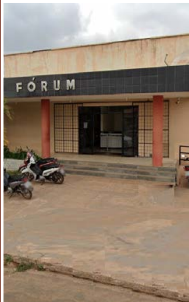
A realização da inspeção cumpre Resoluções do Tribunal de Justiça do Maranhão

As inspeções são realizadas pelos juízes das comarcas no segundo semestre, até a terceira semana de agosto, diante da necessidade de aprimoramento das atividades extrajudiciais, a fim de que se dê maior celeridade aos trabalhos e o saneamento de possíveis irregularidades.