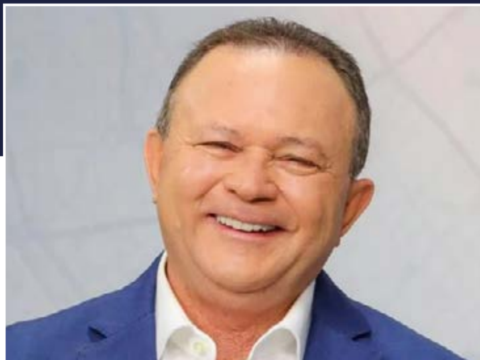
Brandão também apresentou plano de governo

O governador do Maranhão, Carlos Brandão (PSB), apresentou neste fim de semana sua declaração de bens à Justiça Eleitoral.