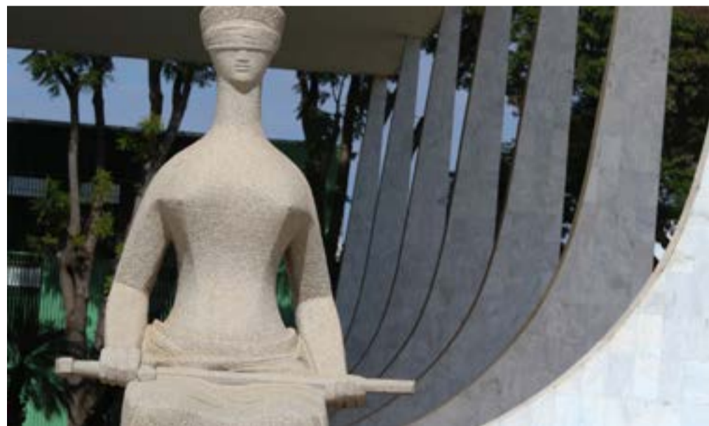
Súmula 450 do TST previa o pagamento em dobro das férias

O entendimento do TST havia sido feito por analogia, pois para a Justiça do Trabalho, ao não pagar as férias dentro do prazo legal, o empregador acaba impedindo o gozo pleno do descanso, o que seria o mesmo que não conceder as férias.