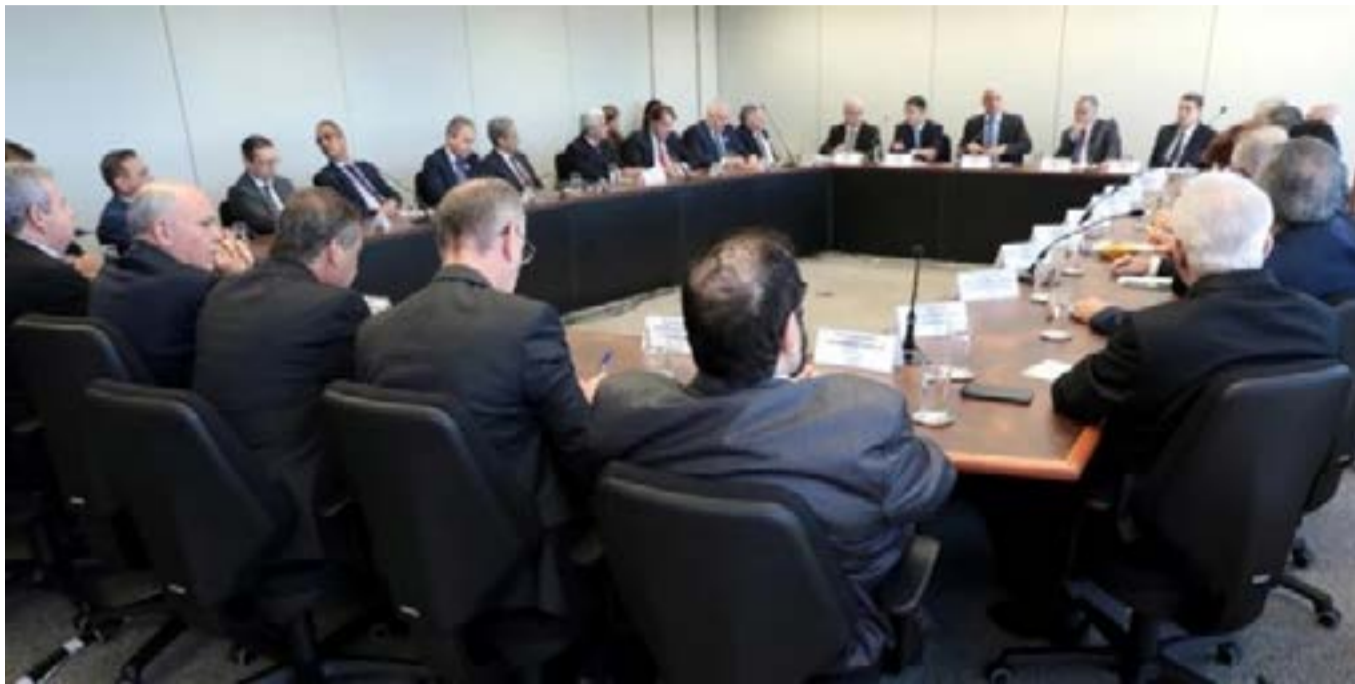
Ministro reuniu-se na manhã desta quarta-feira (17) com os representantes dos 27 Tribunais Regionais Eleitorais (TREs) do país

Temas em debate - A importância do firme combate à desinformação, da articulação com as instâncias locais de segurança, do treinamento das mesárias e dos mesários, e as mudanças na divulgação dos Boletins de Urna (BU) também foram debatidos