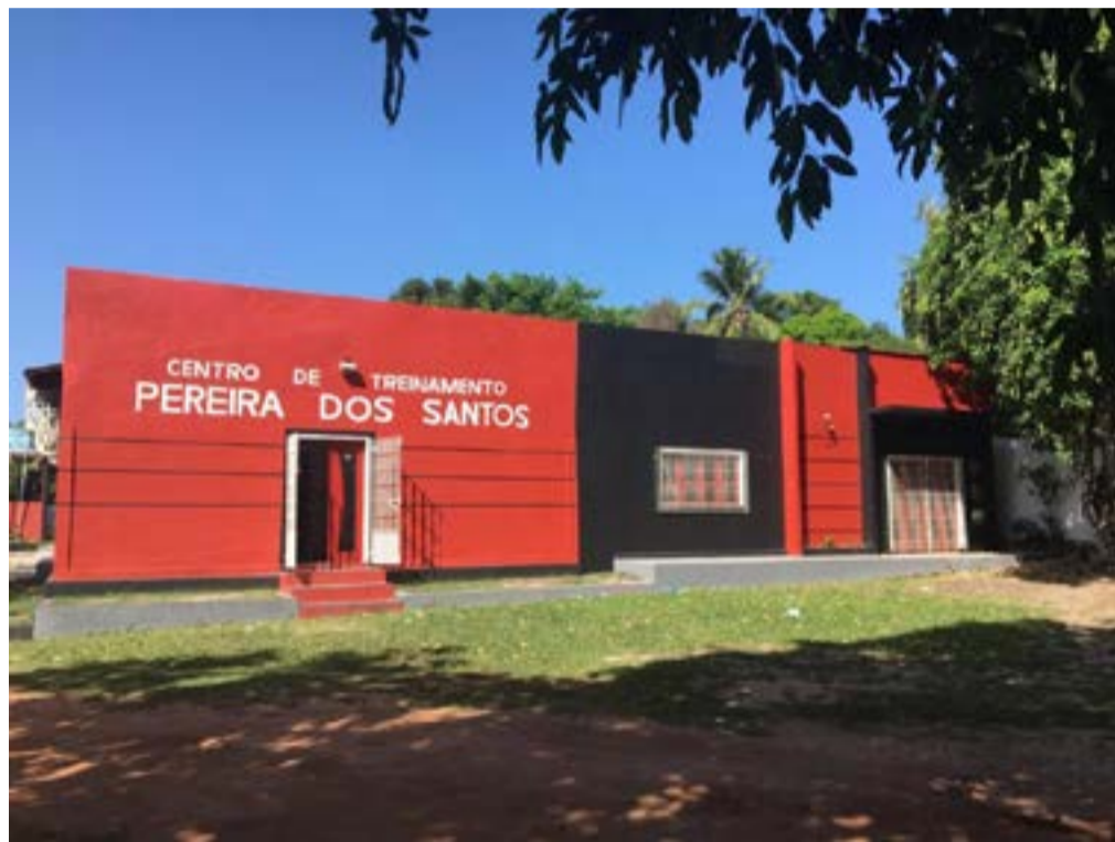
Centro de Treinamento Pereira dos Santos foi invadido por criminosos.

O Centro de Treinamento (CT) Pereira dos Santos, de propriedade do Moto Club de São Luís, foi invadido e assaltado por um grupo armado, na tarde