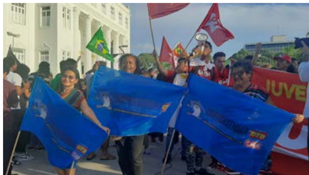
A manifestação aconteceu na Praça Deodoro

Para realizar a inscrição acesse o link do formulário disponível no site do Sinproesemma.