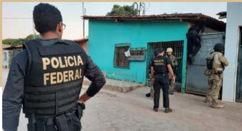
Policiais federais cumprem mandado de prisão contra suspeito de participação em grupo de assaltantes de agência dos Correios

A Polícia Federal deflagrou nesta quarta-feira (17) uma operação batizada de 'Road Trip', que visa desarticular um grupo investigado por roubo contra agências dos Correios.