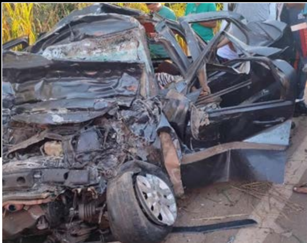
Carro ficou completamente destruído após o acidente

Na madrugada desta terça-feira (16), um grave acidente envolvendo um caminhão boiadeiro e dois carros deixou cinco pessoas mortas. O acidente aconteceu no km 497 da BR-222, próximo a Estrada do Arame, no município de Buriticupu.