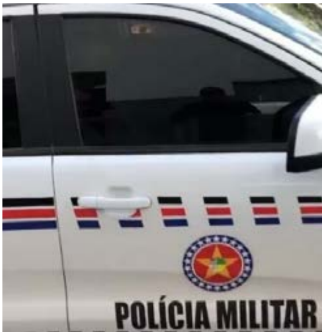
Segundo informações da Polícia Militar, ainda não se sabe com quanto tempo de gestação a mulher estava e se o bebê nasceu vivo.

O corpo do recém-nascido foi encaminhado para o Instituto Médico Legal (IML). A mulher ainda vai ser ouvida pela Polícia Civil.