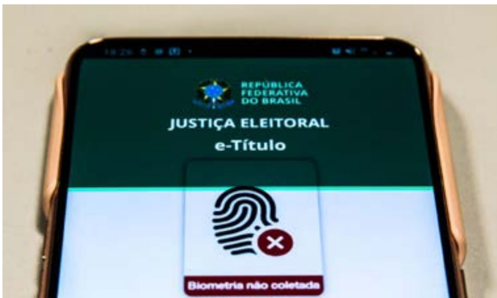
Sistemas operacionais são Apple e Android. Marcello Casal Jr

Segundo o tribunal, mais de 27 milhões de eleitores já baixaram o aplicativo.