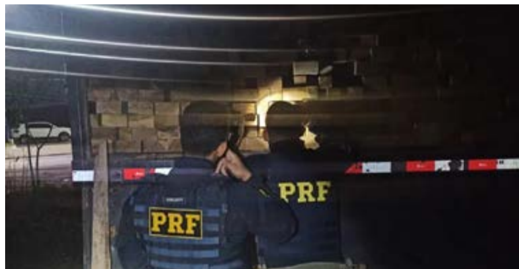
Polícia Rodoviária intercepta carregamentos irregulares de madeira na BR-316 no MA

A nota fiscal dizia que o veículo transportava 44 metros cúbicos de madeira nativa serrada e, segundo a Polícia Rodoviária Federal, todo o carregamento não tinha licença para ser transportado. O veículo e a carga foram apreendidos.