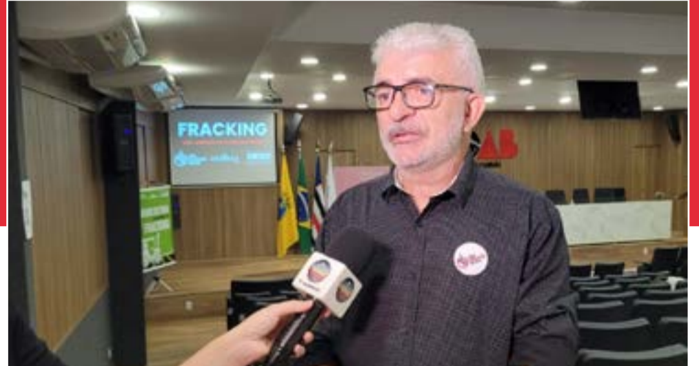
O evento é direcionado a vereadores, assessores e servidores de câmaras municipais