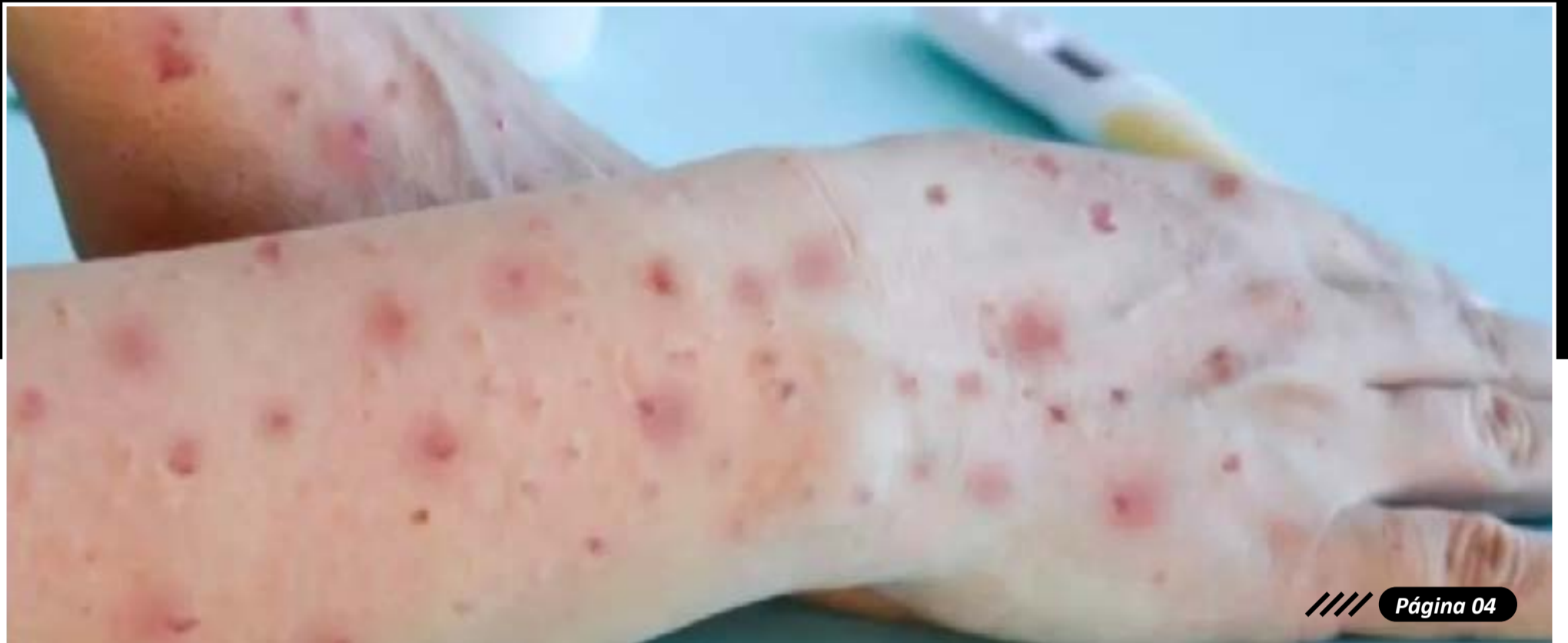
Os pacientes são do sexo masculino: de 20 e 29 anos, com início dos sintomas entre 15 e 20 de agosto.