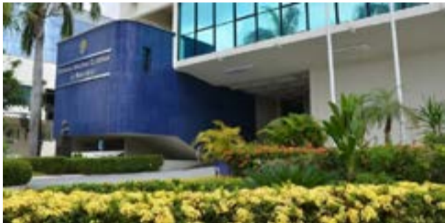
Até o último fim de semana eram apenas dois os candidatos com pedido de registro de candidatura indeferidos pela Justiça Eleitoral

A Justiça Eleitoral segue com o julgamento de pedidos de registros de candidatura de candidatos a deputado estadual e federal; senadores e governador do Maranhão.