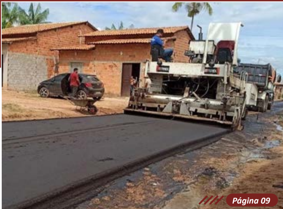
O trabalho segue sendo realizado nas ruas do Bairro