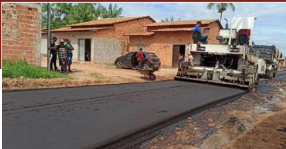
O trabalho segue sendo realizado nas ruas do Bairro

Além do Bairro Alto do Bode, as ruas do Bairro Aline Salgado estão recebendo a pavimentação asfáltica. As máquinas seguem a todo o vapor melhorando a trafegabilidade daquela comunidade.