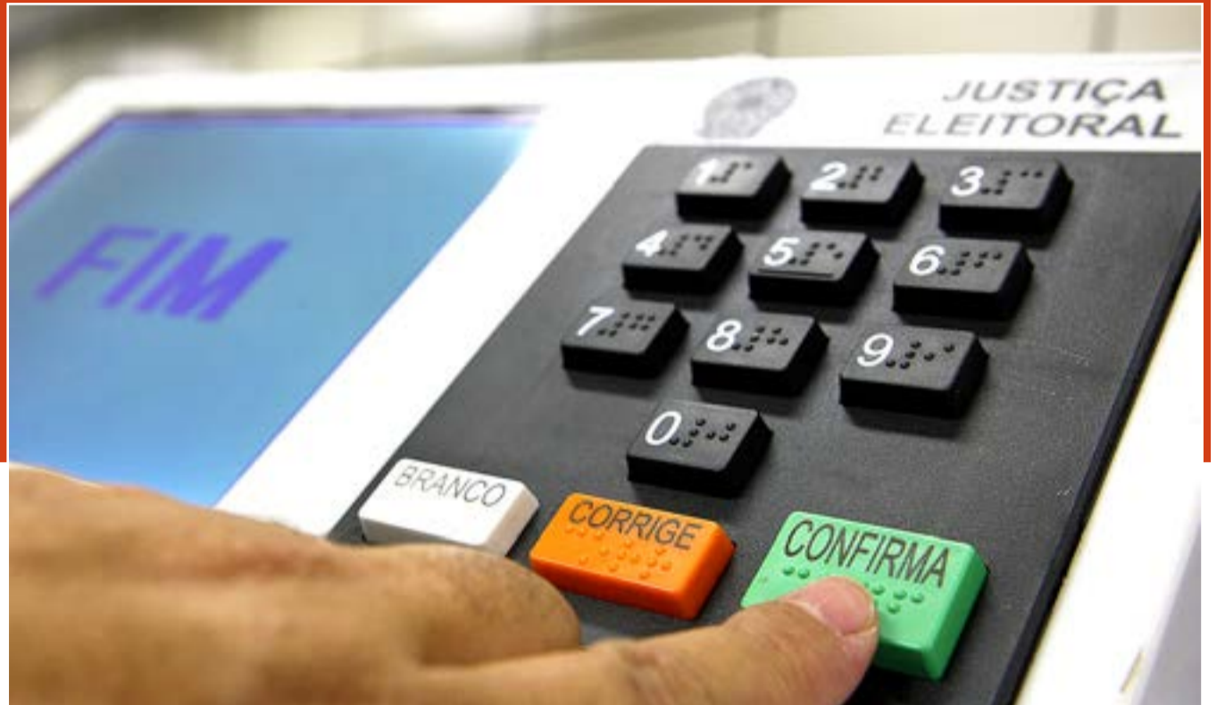
O Nordeste aparece com 2.939 registros.

A Justiça Eleitoral recebeu pelo menos 28 mil registros de candidaturas para as eleições de outubro. Do total, 10.456 disputam uma das 513 vagas de deputado federal.