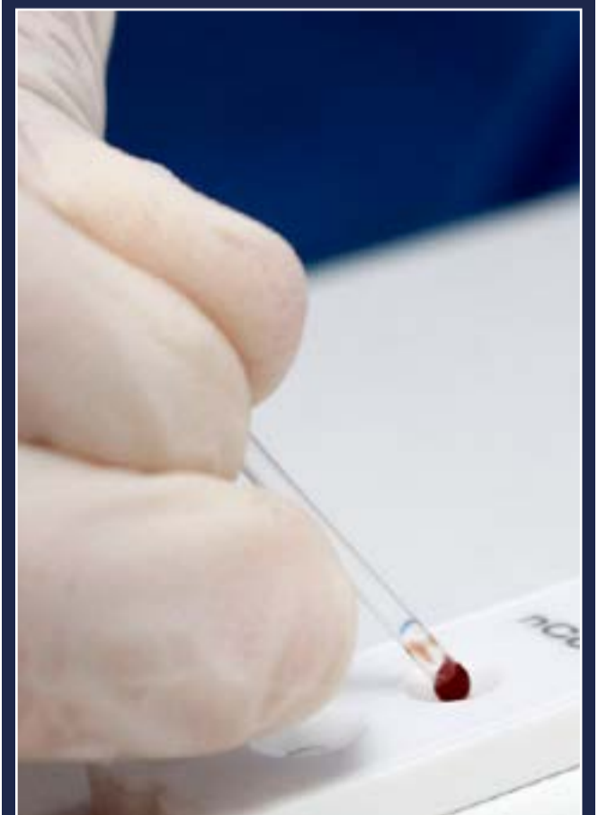
A média móvel de mortes é a menor registrada desde 22 de junho

Em seu pior momento, a média móvel superou a marca de 188 mil casos conhecidos diários, no dia 31 de janeiro deste ano.