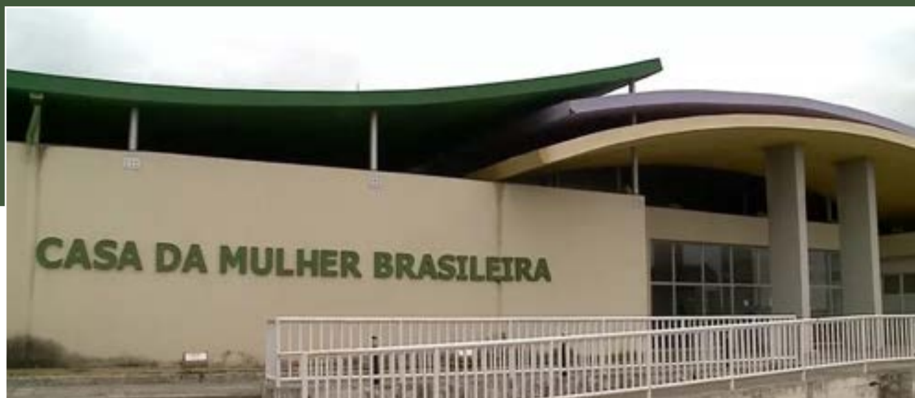
Casa da Mulher Brasileira funciona 24 horas em São Luís