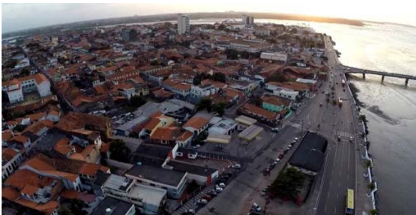
São Luís 410 anos — Foto: Reprodução/g1 MA

São Luís cresceu com a economia do Estado do Grão-Pará e Maranhão. Cana-de-açúcar, cacau e tabaco em primeiro lugar. Depois, veio o ciclo do algodão e do arroz, no século XIX, que tornou a cidade mais rica e deu a ela a maior parte dos casarões que hoje compõem a paisagem arquitetônica do centro da cidade.