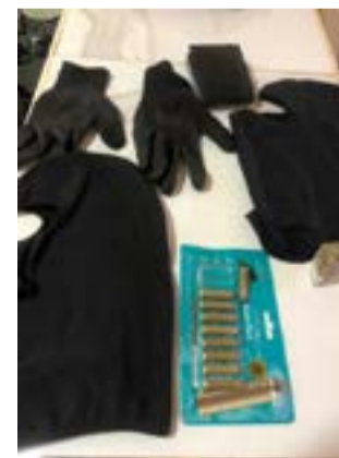
O suspeito foi autuado pela prática do crime de extorsão mediante sequestro qualificada

"A avó da criança nos informou que eles haviam levado a mãe e a criança por conta de uma dívida do filho dela, que é o pai da criança, que está preso em Recife e estaria devendo 9 mil reais para esses indivíduos e eles disseram que só liberariam as vítimas após o pagamento", disse o delegado em entrevista as emissoras de TV.