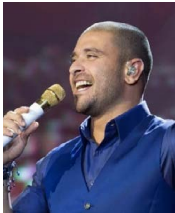
Diogo Nogueira se apresenta nesta quinta-feira (8), na praça Maria Aragão.

O sambista Diogo Nogueira é a atração principal da noite desta quinta-feira (8), na praça Maria Aragão, na festa em comemoração aos 410 anos de São Luís, promovida pela prefeitura da capital maranhense. O Imirante.com transmite a programação, ao vivo, a partir das 19h, por meio do canal do YouTube.