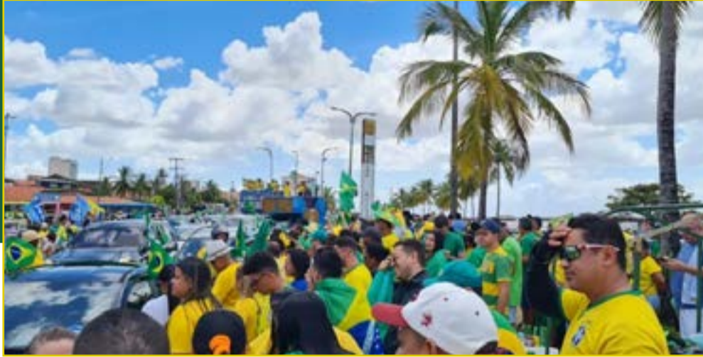
Manifestantes fizeram ato em clima de tranquilidade em São Luís

Foi marcado por tranquilidade e muitas críticas ao Supremo Tribunal Federal (STF) o ato de 7 de Setembro organizado por apoiadores do presidente Jair Bolsonaro (PL) em São Luís.