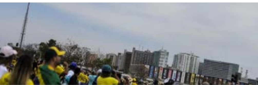
Desfile ocorreu após um hiato de dois anos por conta da pandemia

Sob os olhares e aplausos de milhares de pessoas na Esplanada dos Ministérios, tropas das Forças Armadas, Polícia Militar, Polícia Federal, Polícia Rodoviária Federal e o Corpo de Bombeiros Militar desfilaram na manhã deste dia 7 de setembro nas comemorações do Bicentenário da Independência do Brasil. O desfile ocorreu após um hiato de dois anos devido à pandemia de covid-19.