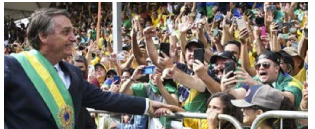
Bolsonaro cumprimenta público durante ato em Brasília

A senadora e candidata Simone Tebet (MDB) condenou as atitudes do presidente no Dia da Independência do Brasil. Nas redes sociais, Tebet destacou que o presidente mostra "todo seu desprezo pelas mulheres e sua masculinidade tóxica e infantil".