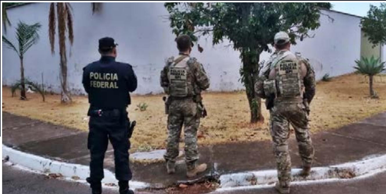
30 policiais federais estão cumprindo cinco mandados judiciais

A obtenção fraudulenta, por despachantes com atuação no Exército, de Certificado de Registro (CR) para atiradores e caçadores é alvo da Operação Registro Armado, da Polícia Federal, nesta sexta-feira (23).