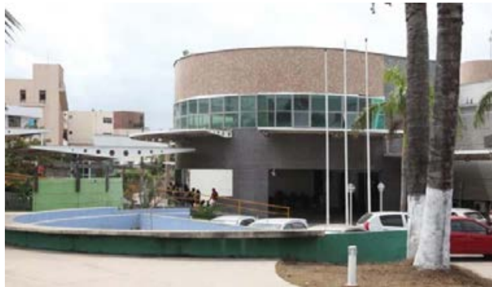
No total, 6515 vagas estão sendo ofertadas pelo IFMA.

Em 30 de dezembro será divulgado o resultado final do processo seletivo com convocação para matrículas.