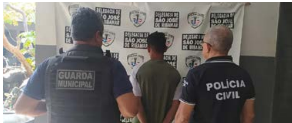
A prisão do suspeito foi feita pela Delegacia Especial de São José de Ribamar, com apoio da Guarda Municipal.

A polícia segue investigando o caso para tentar capturar os outros envolvidos.