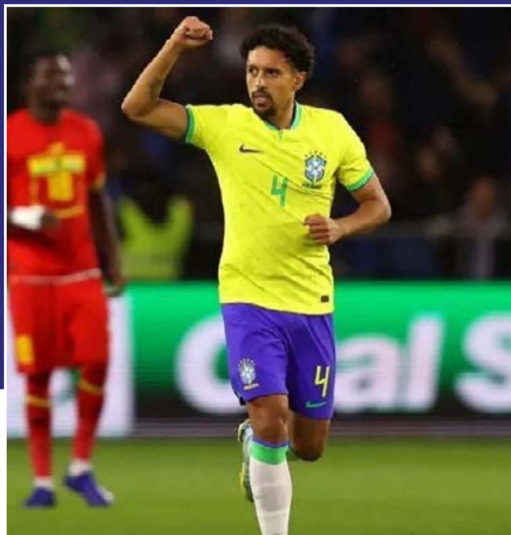
Marquinhos comemora gol em amistoso contra Gana

A seleção brasileira masculina de futebol venceu o amistoso contra Gana nesta sexta-feira (23) por 3 a 0, com dois gols de Richarlison e um de Marquinhos, todos no primeiro tempo. Essa foi a penúltima partida da Canarinha antes da Copa do Mundo do Catar.