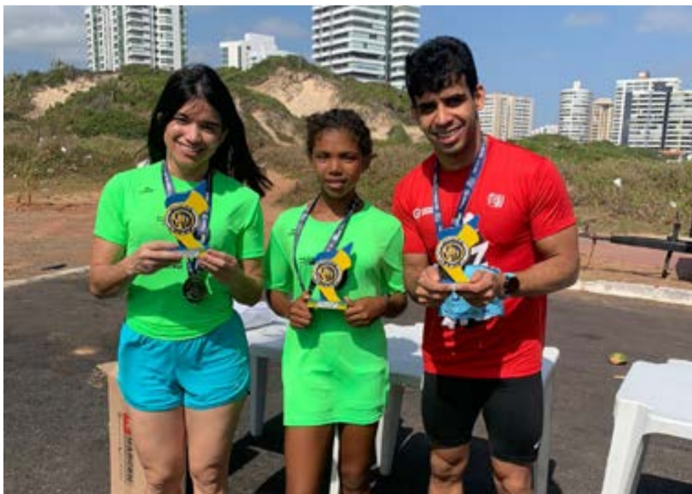
A pindareense ficou em segundo lugar em uma corrida realizada em São Luís