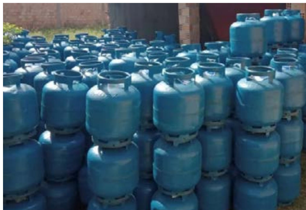
Redução passa a valer a partir de amanhã