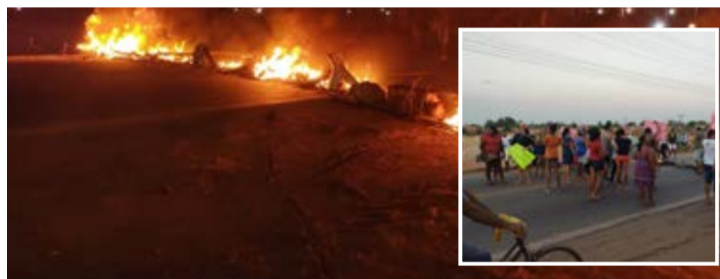
Os moradores atearam fogo em pneus durante o protesto

O Jornal do Vale solicitou da Secretaria de Estado da Comunicação Social uma nova nota sobre o caso e divulgará assim que receber.