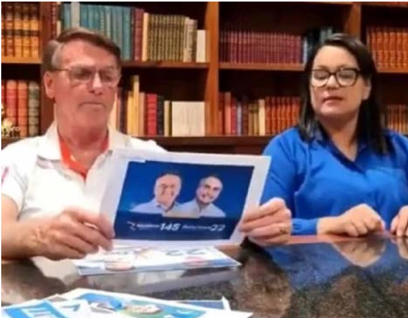
Bolsonaro afirmou que continuará neutro no Maranhão por ter três candidatos que simpatizam com sua candidatura

“No Maranhão tem três candidatos ao Governo que são simpáticos a gente. Vamos ficar aí isento. Se tivermos o segundo turno, dependendo do que vai acontecer, a gente vai trabalhar melhor lá no Maranhão. Mas, como não tem segundo turno [para o Senado] e temos um excelente nome lá que é o Roberto Rocha, que vem para a reeleição...”, enfatizou.