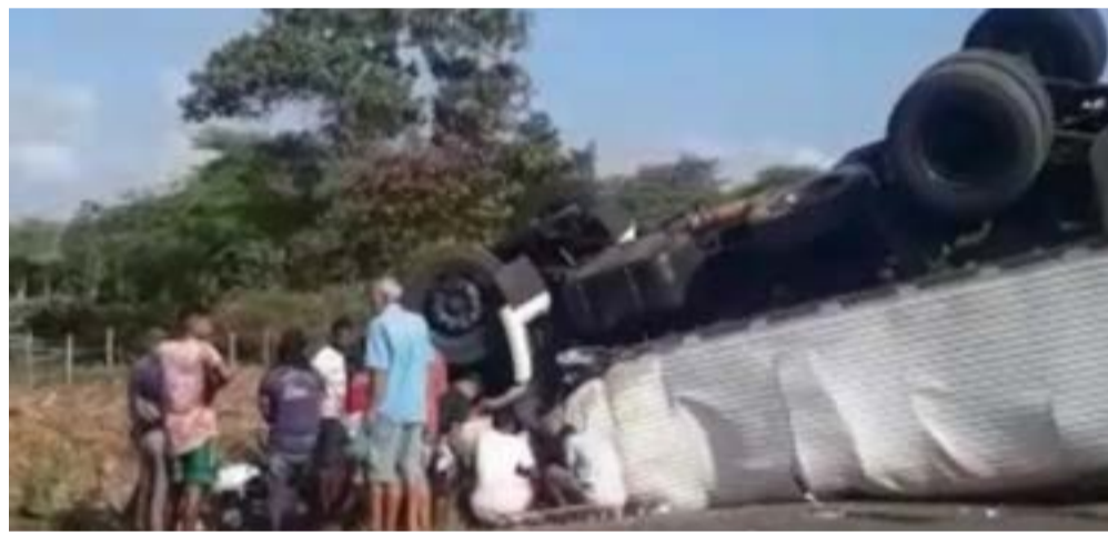
De acordo com a PRF, o caminhão-cegonha colidiu de forma lateral com outro caminhão

Por conta do acidente, o trânsito ficou lento na BR-135, mas foi controlado por agentes da PRF. O caso será investigado pela Delegacia Regional de Santa Rita.