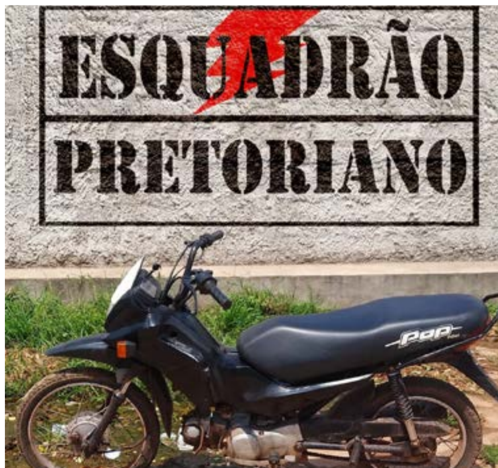
Motocicleta recuperada pelo Esquadrão Pretoriano

Diante dos fatos o conduzido foi entregue na Delegacia Regional de Santa Inês e foi constatado que o indivíduo estava com mandado de prisão em aberto, pois não retornou ao Complexo Penitenciário após saída temporária de Natal em 2021.