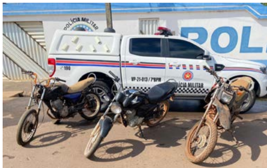
A apreensão dos veículos foi na MA-006