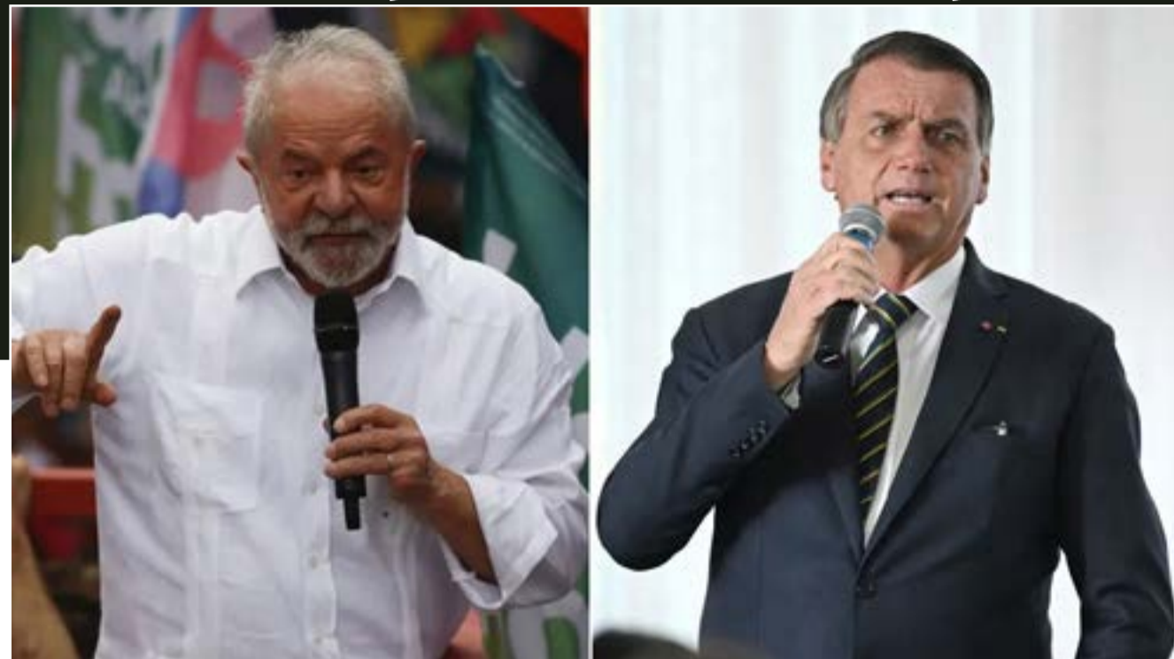
O ex-presidente Lula e o presidente Bolsonaro

Pesquisa Datafolha divulgada nesta sexta-feira (7), encomendada pela Globo e pela "Folha de S.Paulo", aponta que o ex-presidente Luiz Inácio Lula da Silva (PT) tem 49% de intenção de votos no segundo turno e que o presidente Jair Bolsonaro (PL) tem 44%. Este é o primeiro levantamento do instituto feito após o primeiro turno das eleições.