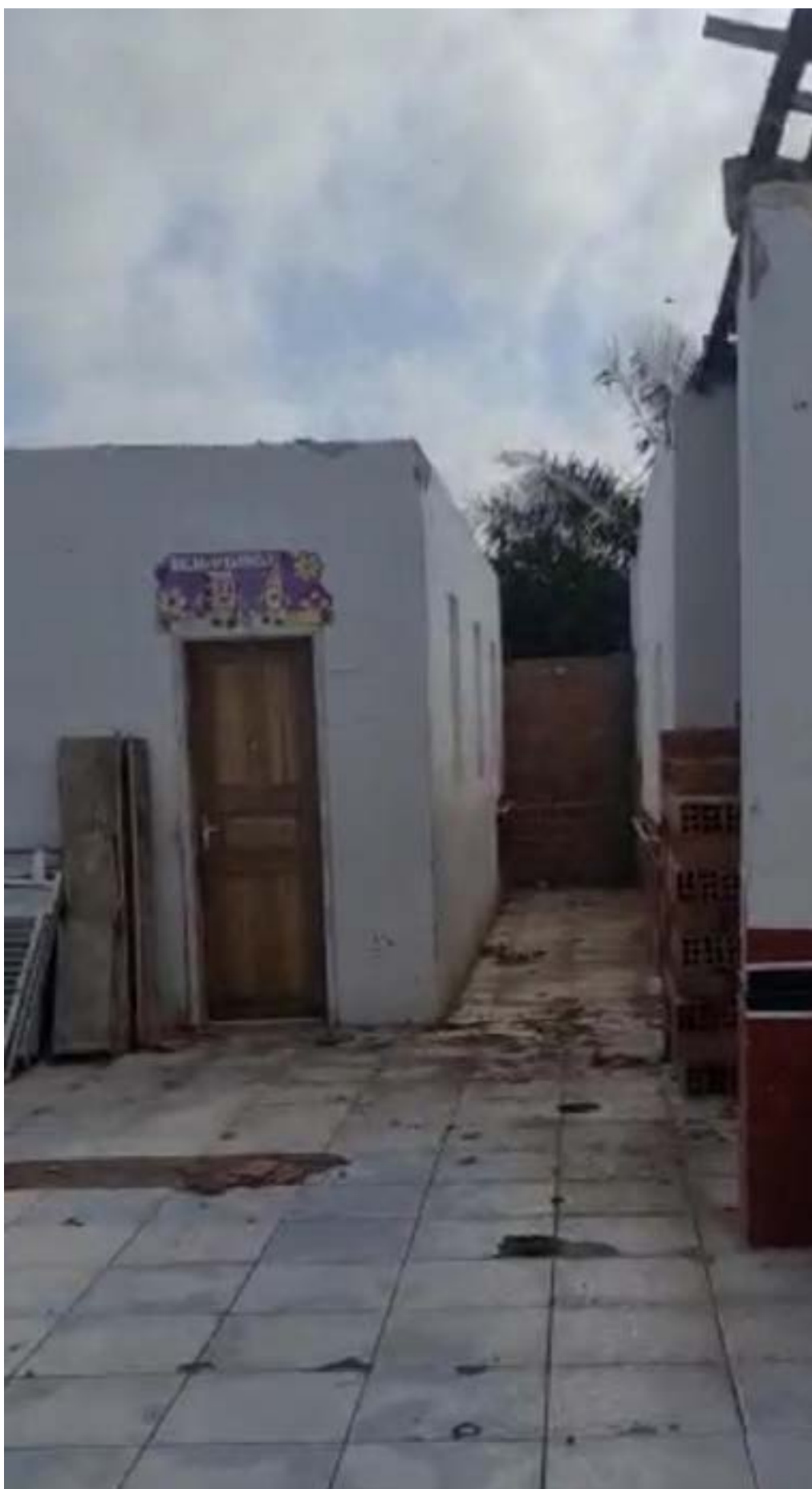
Serão reinauguradas em breve as Escolas Raimunda de Nazare Jansen, José Manoel da Silva e o Caicquinho

Serão reinauguradas em breve as Escolas Raimunda de Nazare Jansen, José Manoel da Silva e o Caicquinho.