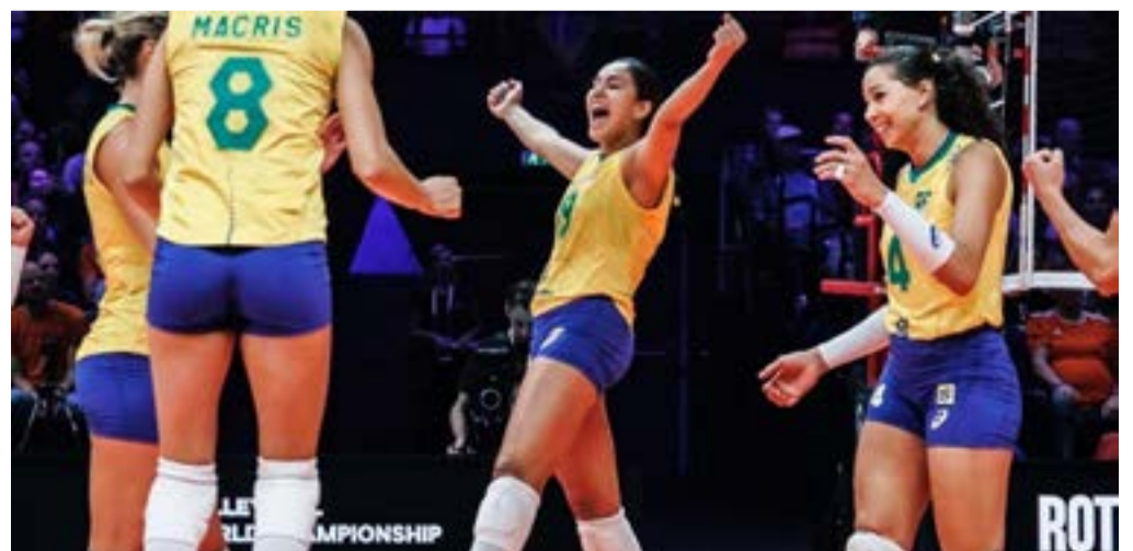
Brasileiras encaram Bélgica neste sábado, em último jogo da 2ª fase

A seleção brasileira emplacou a quarta vitória seguida no Mundial de Vôlei de vôlei feminino e, praticamente, assegurou presença nas quartas de final da competição, em Roterdã (Holanda). Nesta sexta-feira (7), as brasileiras derrotaram as anfitriãs holandesas por 3 sets 0 (25/19, 25/19 e 25/20). O Brasil, comandado pelo técnico José Roberto Guimarães, é o segundo colocado no Grupo E, com 20 pontos, atrás da líder Itália, com dois a mais. Avancam às quartas de final as quatro equipes primeiras colo-