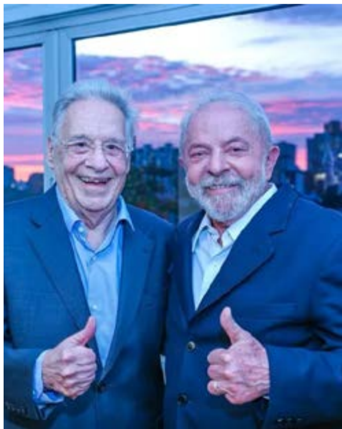
Lula e Fernando Henrique Cardoso

O ex-presidente Luiz Inácio Lula da Silva (PT) se encontrou com ex-presidente Fernando Henrique Cardoso (PSDB) na casa do tucano, na capital paulista, nesta sexta-feira (7). FHC havia anunciado, na quarta-feira (5), apoio ao petista no segundo turno da disputa presidencial.