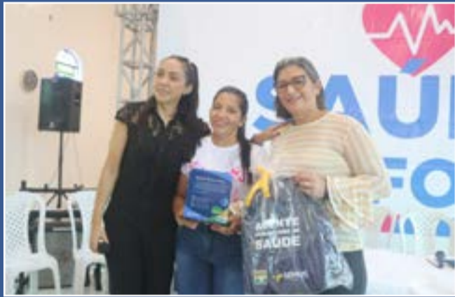
Os agentes receberam novo material e foram homenageados pelos serviços prestados