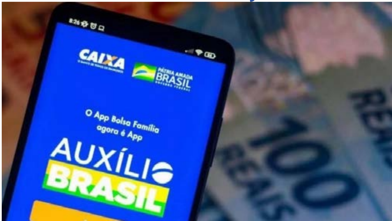
Saiba quais são as regras do empréstimo consignado do Auxílio Brasil

No empréstimo consignado, o desconto é direto na fonte. Em razão de as parcelas serem descontadas diretamente da folha de pagamentos, os bancos têm a garantia de que as prestações serão pagas em dia.