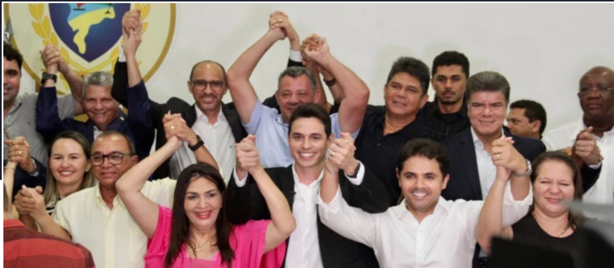
Prefeito de Pindaré Mirim faz parte da chapa vitoriosa