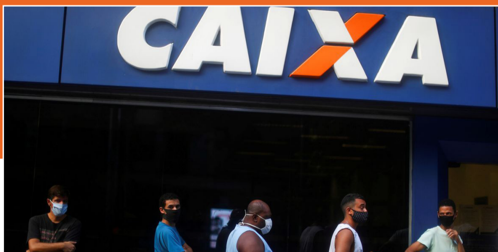
Anúncio foi feito pela Febraban.

As agências bancárias terão horário especial de atendimento ao público nos dias de Copa do Mundo em que a seleção brasileira jogar. A decisão foi anunciada pela