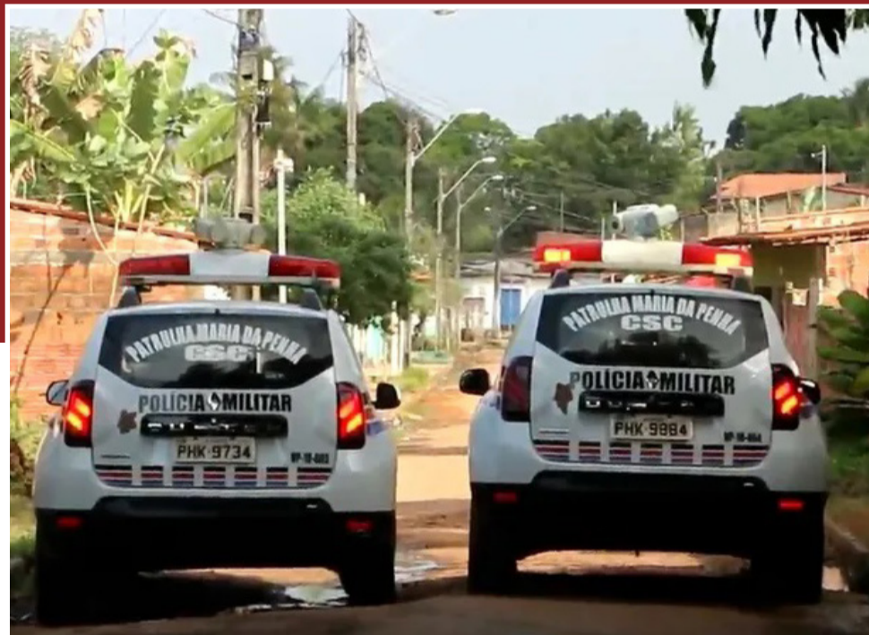
Viaturas da Patrulha Maria da Penha

De janeiro a novembro deste ano, foram registrados 64 casos de feminicídios no Maranhão. São sete casos a mais do que o registrado em todo o ano passado no Estado. E, apesar de todos os crimes terem sido elucidados, apenas 37 homens estão presos.