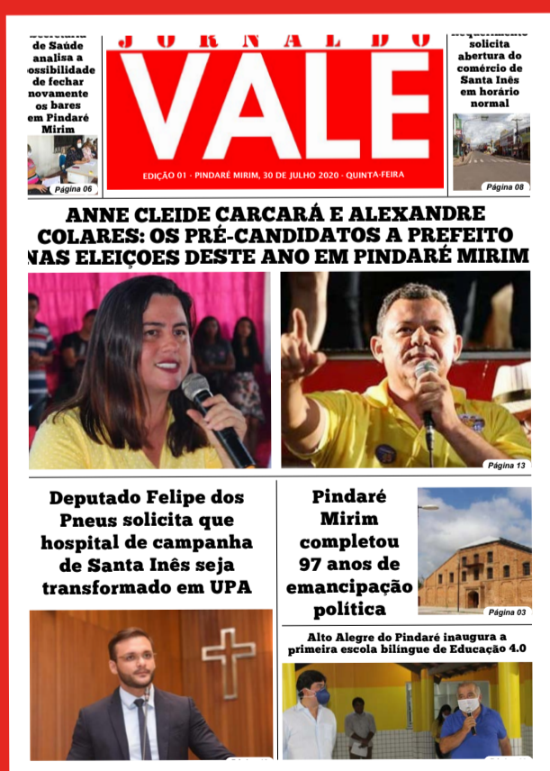
CAPA EDIÇÃO 01