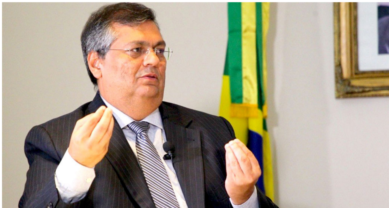
Senador eleito é um dos membros da equipe de transição do presidente eleito, Luiz Inácio Lula da Silva, e faz parte do setor de Justiça e Segurança Pública

O senador eleito e ex-governador do Maranhão, Flávio Dino (PSB), é um dos membros da equipe de transição do presidente eleito, Luiz Inácio Lula da Silva (PT). Em entrevista ao Imirante, ele falou sobre os trabalhos que iniciou na semana passada na equipe de Justiça e Segurança Pública. Segundo ele, o decreto do 100 anos e o do que trata sobre armas são principais focos das atividades.