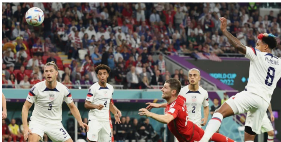
A partida aconteceu no Estádio Ahmad Bin Ali em Al Rayyan, município do Catar

Depois do gol, as duas equipes preferiram preservar o resultado.