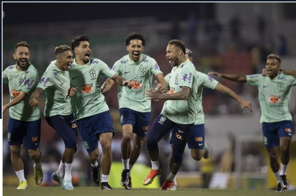
Em ritmo de trabalho e alegria, seleção brasileira faz treinamentos no Catar.

Nesta quinta-feira (24) a seleção brasileira faz sua estreia na Copa do Mundo 2022 contra a seleção da Sérvia. O jogo é válido pela primeira rodada do Grupo G da competição, e está marcado para iniciar às 16h00 (horário de Brasília) no Estádio Nacional de Lusai, na cidade de Lusai, no Catar.