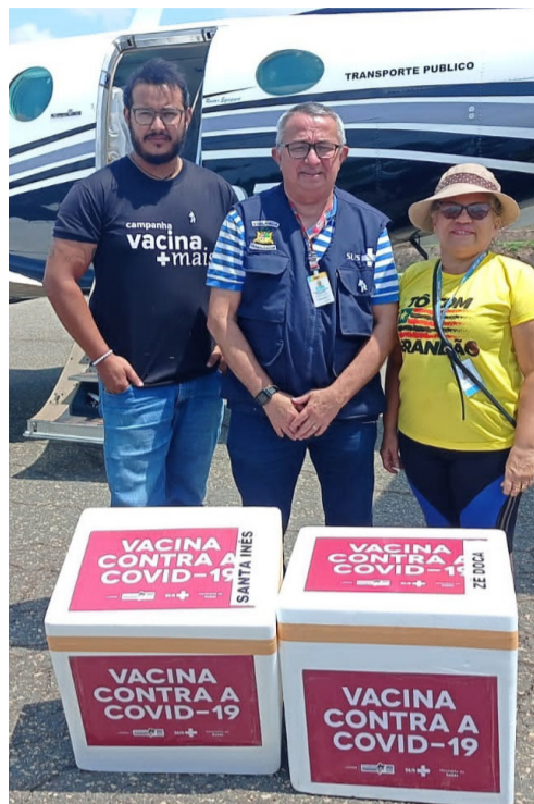
Doses da vacina serão entregues aos municípios da região

No início da tarde da última sexta-feira, 18, a Unidade Regional de Saúde de Santa Inês recebeu da Secretaria de Estado da Saúde 740 doses da vacina infantil contra a covid-19. O lote chegou em um Helicóptero no Aeroporto Regional de Santa Inês.