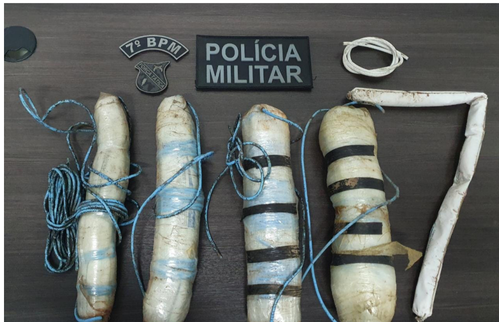
Artefatos foram encontrados próximos ao local onde foi localizado um carro utilizado pelo bando no referido assalto

Constatando a materialidade da informação e impossibilitado de solicitar apoio para uma equipe especializada devido a falta de rede no local, estes policiais buscando retirar os explosivos de próximo da comunidade para resguardar a segurança dos moradores, decidiram por removê-los com os meios disponíveis para evitar qualquer mal a comunidade e apresentá-lo na Delegacia de Polícia Civil em Santa Inês para as providências cabíveis.