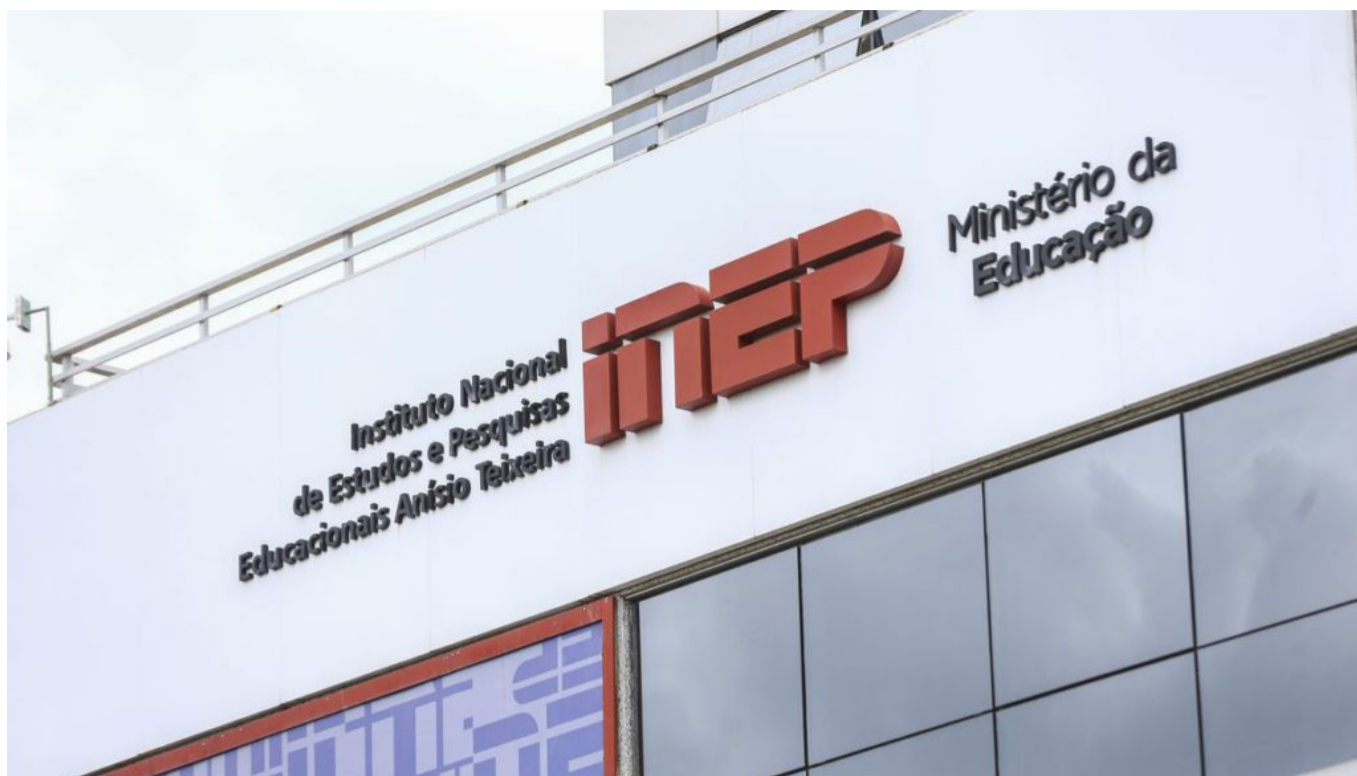
O cronograma foi divulgado nesta segunda-feira pelo Instituto Nacional de Estudos e Pesquisas Educacionais Anísio Teixeira.

Os gabaritos poderão ser acessados no portal do Inep. Já os resultados finais, na Página do Participante. Mesmo com os gabaritos das provas em mãos, ainda não será possível saber qual foi a nota da prova. Isso porque o Enem utiliza como método de