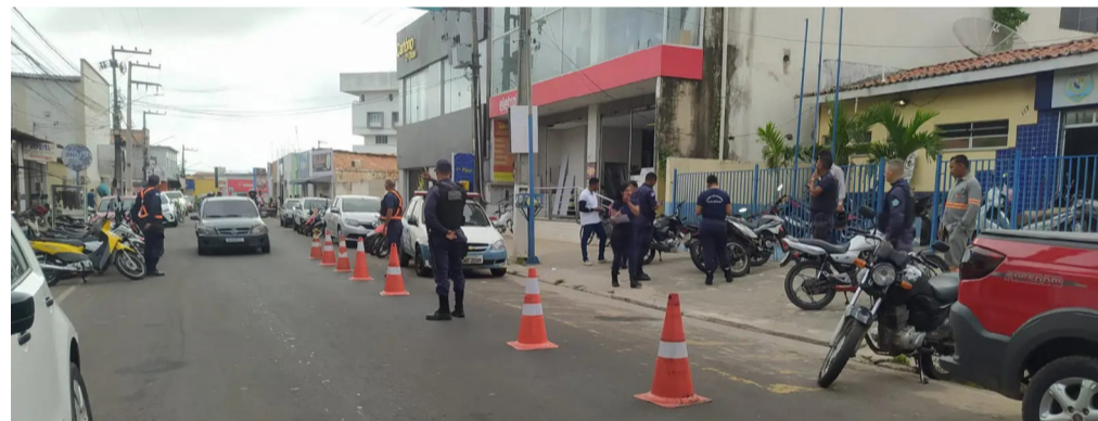
A Operação Trânsito Seguro também conta com a parceria e apoio da Polícia Militar

A Operação Trânsito Seguro também conta com a parceria e apoio da Polícia Militar. O trabalho em conjunto fiscaliza veículos com descarga livre, sem placa de identificação, veículos com restrições de furto/roubo e documentações dos veículos e condutores.