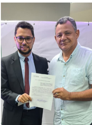
Assinatura aconteceu na manhã desta terça-feira em São Luís

"É um Termo de Cooperação de Trabalho. Vamos trabalhar com o serviço judiciário, extrajudicial, Governo do Estado,