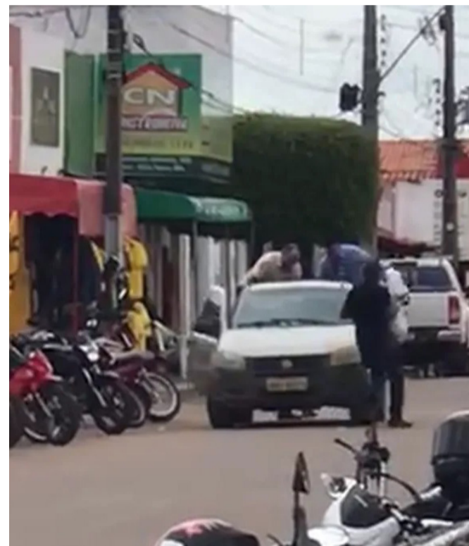
Durante o crime, os bandidos ainda fizeram funcionários reféns.

Na manhã desta terça-feira (29), criminosos armados roubaram uma agência do Bradesco, na cidade de Sítio Novo, a 690 km de São Luís. Durante o crime, os bandidos ainda fizeram funcionários reféns.