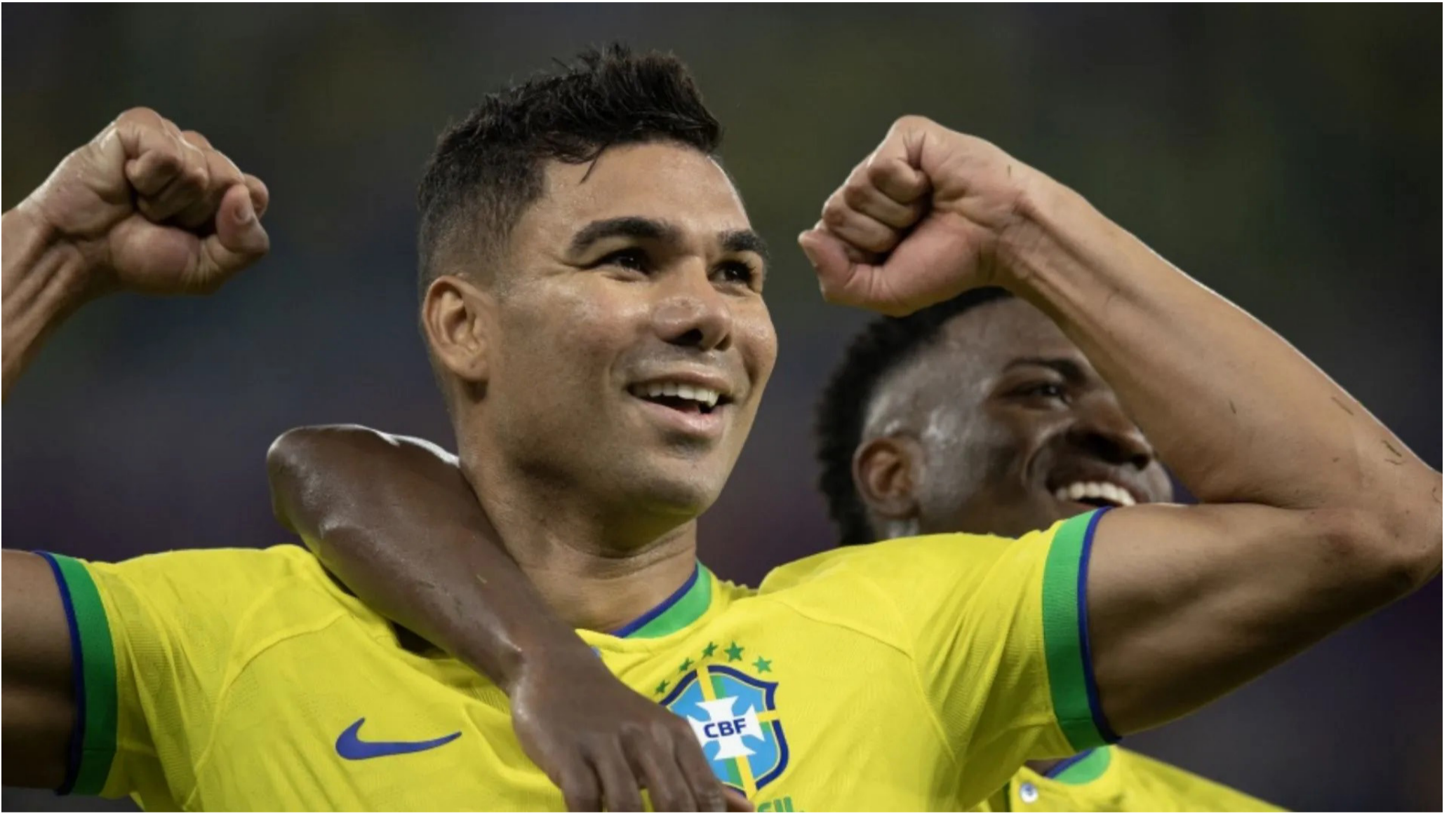
O gol de Casimiro no último jogo garantiu que o Brasil dispute a última rodada contra Camarões com tranquilidade

O Brasil cumpriu o seu primeiro objetivo na Copa do Mundo do Catar: venceu por 1 a 0 a Suíça, nesta segunda-feira, e garantiu matematicamente a classificação para as oitavas de final do torneio — ela é a segunda até aqui, junto com a França. Mas o trabalho na fase de grupos ainda não chegou ao fim. A Canarinho ainda enfrenta Camarões na próxima rodada para garantir a liderança do Grupo G. E as contas para isso acontecer são até simples.