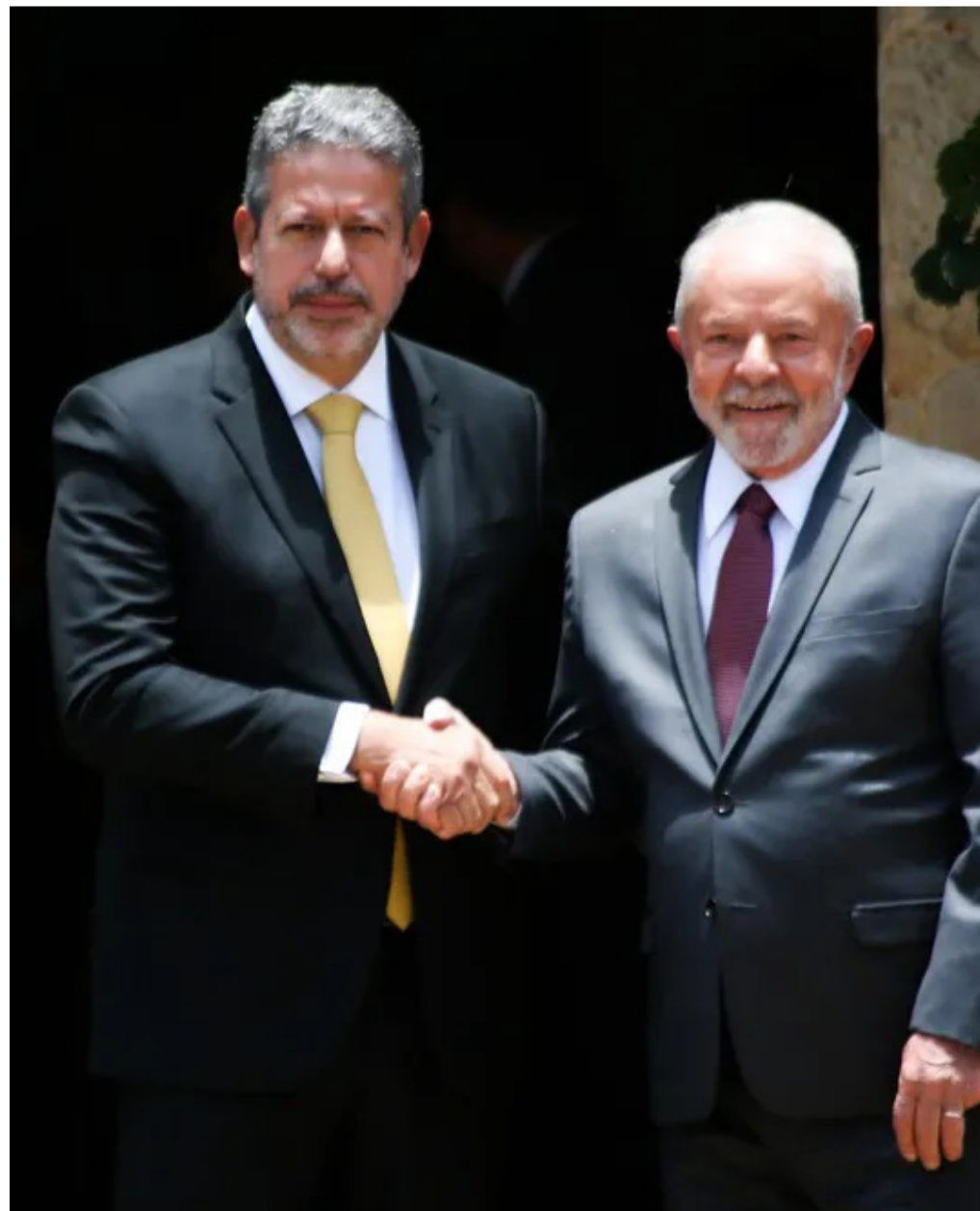
O presidente eleito, Lula (PT), se encontra com o presidente da Câmara dos Deputados, Arthur Lira (PP-AL)

O apoio a Lira passa por uma articulação para garantir governabilidade ao presidente eleito, Luiz Inácio Lula da Silva (PT). A eleição para presidência da Casa será no início de fevereiro.