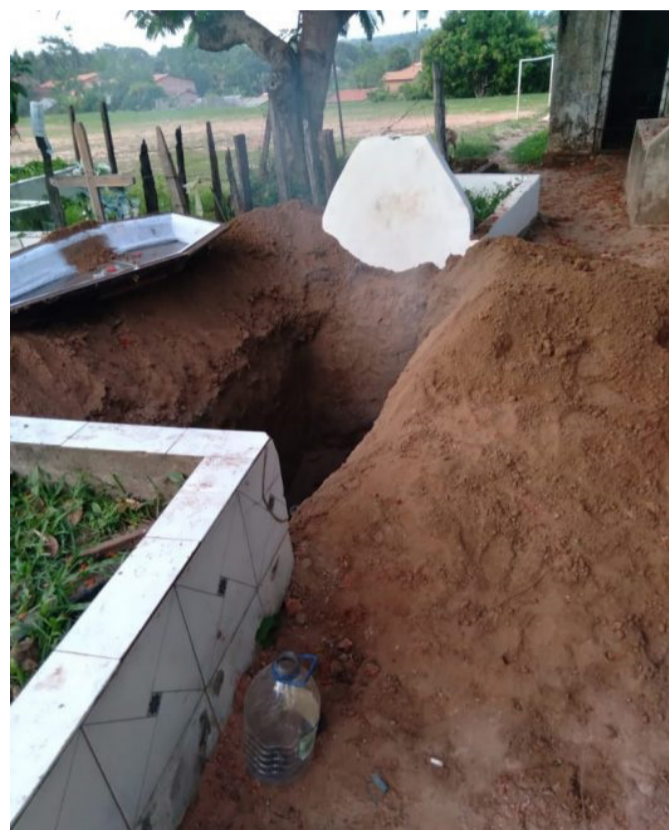
Foi encontrado um garrafão com combustível próximo ao local.

No município de Bom Jardim a Polícia Civil registrou o caso de uma sepultura encontrada aberta nessa segunda-feira (28). Segundo os policiais, o corpo que estava dentro do caixão foi desenterrado e queimado.