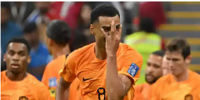
Holanda venceu o Catar e se classificou às oitavas da Copa.

Nesta segunda-feira (29), a Holanda bateu o Catar, confirmou a liderança do Grupo A e avançou às oitavas de final da Copa do Mundo. Os gols da vitória por 2 a 0 foram marcados por Cody Gakpo e Frenkie de Jong.