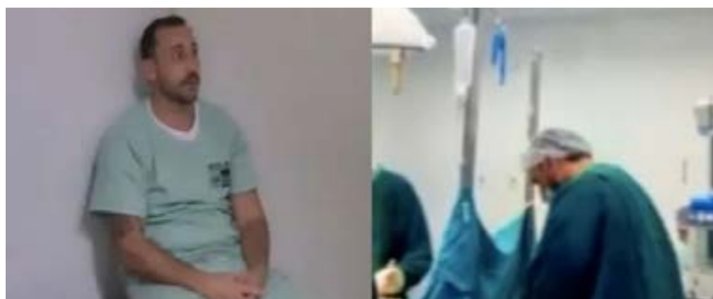
Acusado alega ilegalidade da prova, que foi vídeo feito pela equipe