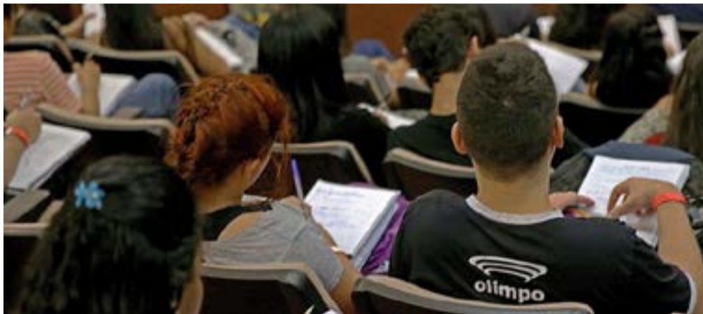
Esta próxima edição do Enem será realizada nos domingos 13 e 20 de novembro

Se você vai fazer o Exame Nacional do Ensino Médio deste ano de 2022, fique atento, pois os locais de prova já estão sendo divulgados pelo Instituto Nacional de Estudos e Pesquisas Educacionais Anísio Teixeira (Inep), na Página do Participante do Enem.