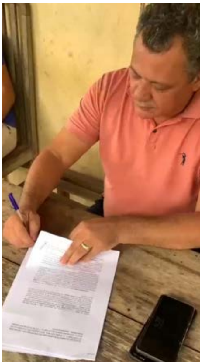
Anúncio foi feito através de um vídeo publicado nas redes sociais

“O juiz homologando, nós vamos partir para liberação do recurso e a construção da Lei Municipal que vai dizer os critérios para o rateio, para a divisão do dinheiro. Esses serão os próximos passos a ser tomado”, disse o sindicato ao Jornal do Vale.