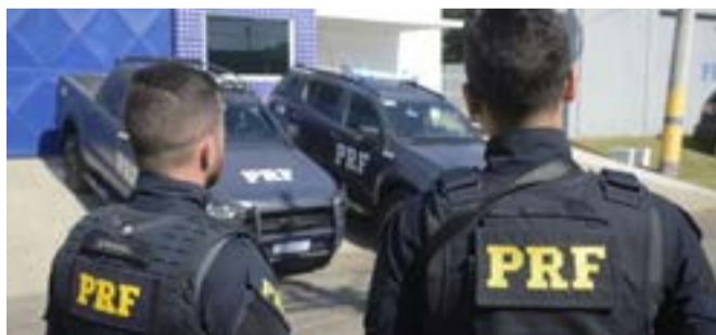
Até o fim da manhã de hoje, 17 estados ainda registram bloqueios em rodovias

Os protestos são promovidos por grupos que não aceitam o resultado das eleições e a vitória de Luiz Inácio Lula da Silva (PT) contra o presidente Jair Bolsonaro (PL) nas urnas. Na tarde de terça-feira (1º), o presidente Jair Bolsonaro se pronunciou pela primeira vez sobre o resultado das urnas e comentou os protestos que ocor-