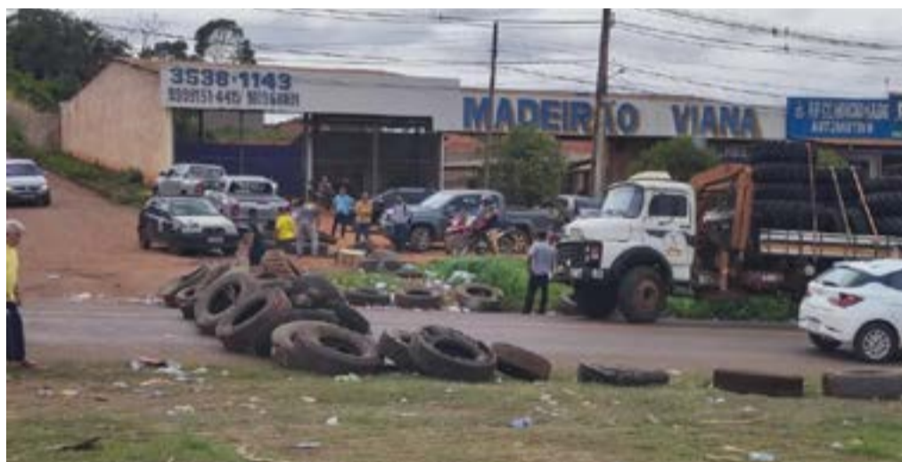
Bloqueio realizado por manifestantes em Açailândia

Manifestantes contrários ao resultado das urnas no último domingo (30) mantêm, nesta quarta-feira (2), interdições parciais na BR-010, situado na cidade de Açailândia, a 562 km de São Luís.