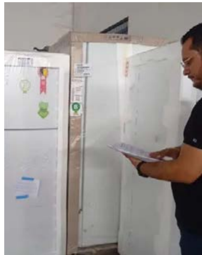
Além das cadeiras, mesas e armários, a mobília conta com kits refeitórios completos, câmaras frias e freezers

A Semed – Secretaria Municipal de Educação – já começou a instalar mobília nova nas escolas municipais de Santa Inês. A Prefeitura fez um investimento de aproximadamente 4 milhões de reais na aquisição de equipamentos, entre eles, ar-condicionados.