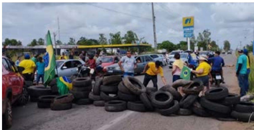
Manifestantes interditam o Km 372 da BR-316 em Bacabal

Os veículos estão trafegando pelo acostamento, já que os manifestantes derramaram material pela pista. Também foi interditado por manifestantes o Km 372 da BR-316, situado na cidade de Ba-