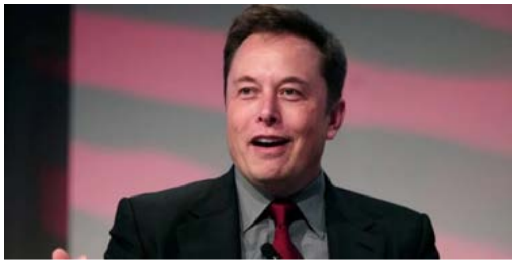
Empresário Elon Musk é o novo proprietário do Twitter

Elon também se tornou o CEO da rede social ao demitir todo o conselho da empresa, o que indica a possibilidade de novas mudanças na estrutura da plataforma.