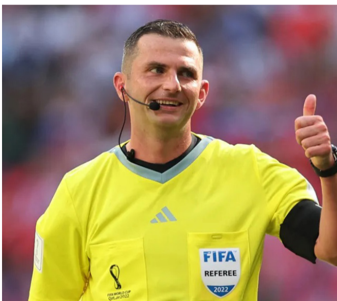
Árbitro inglês Michael Oliver em Japão x Costa Rica