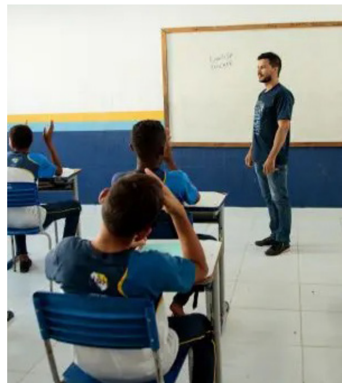
É obrigatório apresentar documento oficial com foto na hora da votação

É muito importante que a comunidade escolar participe desse momento em que vai definir um novo tempo na educação de Santa Inês. E o compromisso da atual gestão, é que a educação de Santa Inês siga evoluindo.