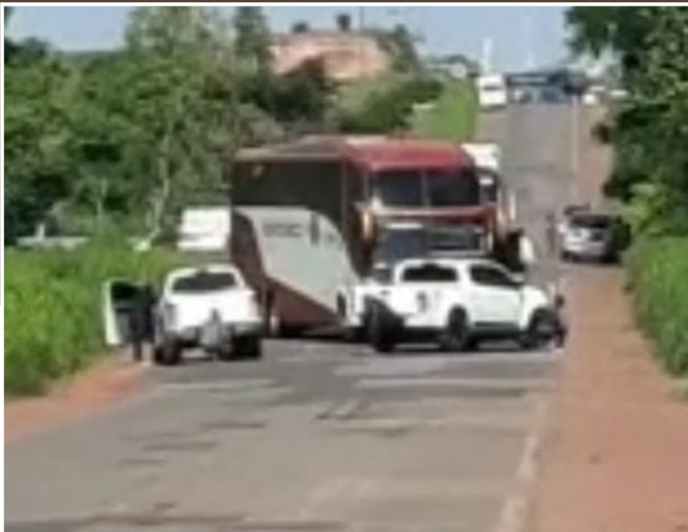
Os dois indivíduos embarcaram em Santa Inês com destino a Açailândia

Por volta das 15h desta quarta-feira, 07, a guarnição da Polícia Militar foi acionada após uma denúncia informando que um dos ônibus de uma agência com destino à Açailândia estaria sendo roubado e que, o referido ônibus estaria atravessado na BR-222, com os dois indivíduos armados no interior do veículo com aproximadamente 30 passageiros em suas custódias.