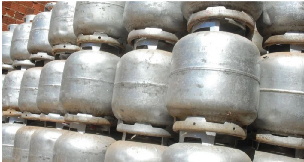
Segundo a estatal, o valor médio pago por essas empresas a cada 13kg do combustível terá uma queda de R$ 4,55.

A Petrobras afirma que o ajuste no preço anunciado hoje acompanha a evolução dos valores de referência no mercado internacional. A empresa justifica que sua prática de preços é buscar o equilíbrio dos seus preços com o mercado sem o repasse para os valores internos das variações constantes nos preços de negociação do GLP e do dólar no exterior.