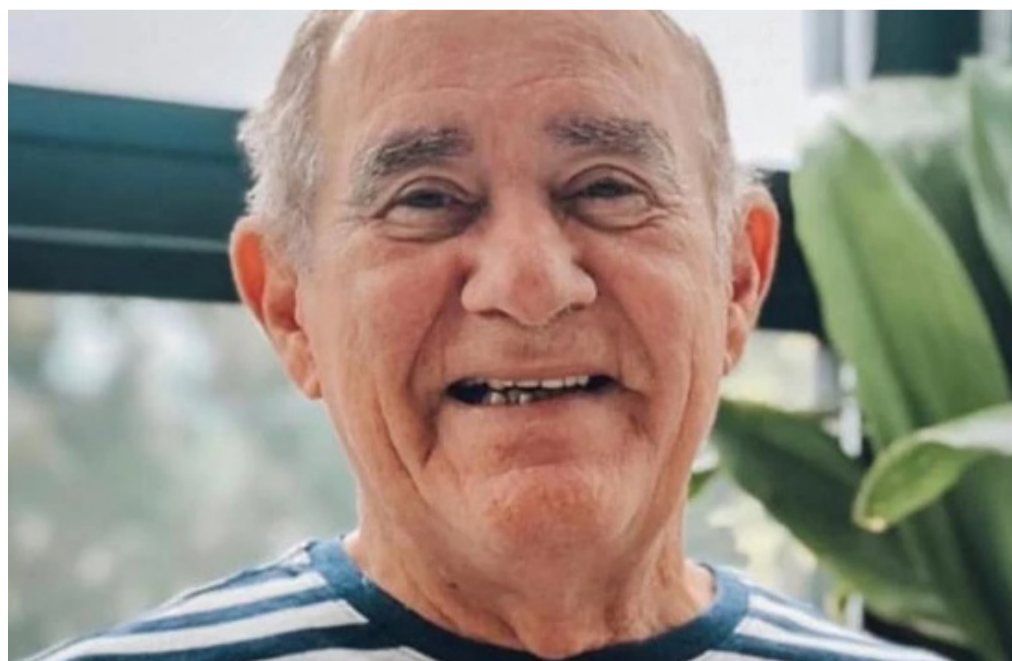
Humorista Renato Aragão, de 82 anos, foi internado no Hospital Samaritano.

O ataque isquêmico Transitório (AIT) é quando uma artéria cerebral entope ou se rompe, causando um déficit neurológico. O AIT acontece de repente e dura de 2 a 30 minutos. Os sintomas dependem do tempo em que o cérebro deixa de receber sangue e oxigênio e podem ser: perda de sensibilidade em alguma parte do corpo, enjoo, fala enrolada, dificuldade de expressão, incontinência urinária, desequilíbrio, síncope, paralisia nos membros inferiores e superiores e visão dupla.