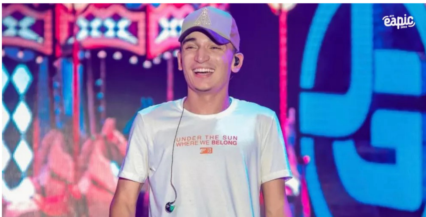
João Gomes

A repercussão gerou discussão entre os moradores. Muitos não aprovam o gasto que será desembolsado com o show. Moradores que vivem a mais tempo na cidade, dizem que o dinheiro poderia ser usado melhor em áreas essenciais.