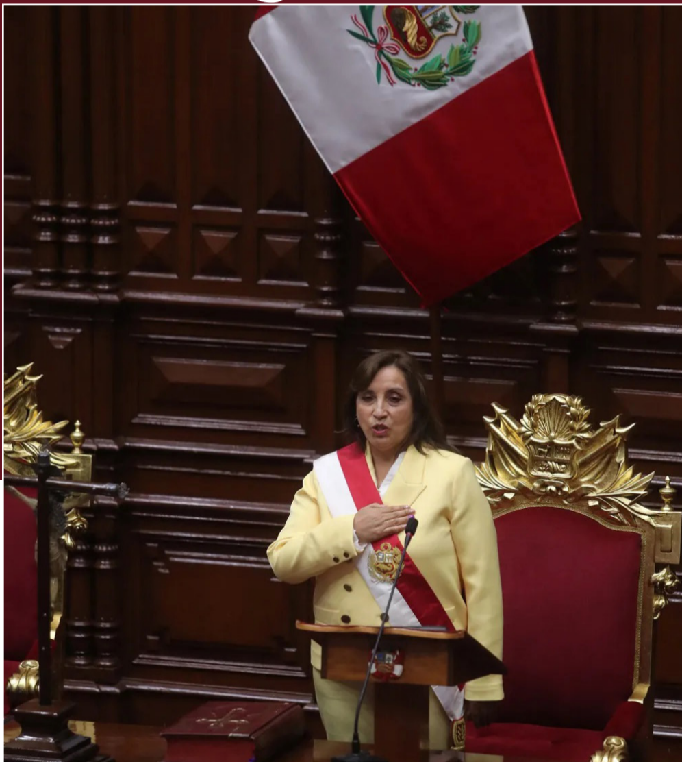
Dina Boluarte ao assumir a presidência do Peru

Dina Boluarte, que era a vice-presidente de Pedro Castillo, assumiu a presidência do Peru nesta quarta-feira (7) e, assim, tornou-se a primeira mulher a liderar o país.