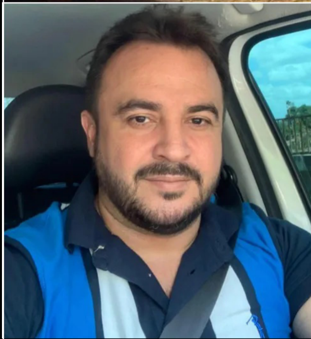
Vereador Teódulo Aragão morreu durante um acidente de trânsito

No início da manhã desta quarta-feira (7), um acidente de trânsito na BR-316 causou a morte do vereador e presidente da Câmara Municipal de Caxias, Teódulo Aragão (PP), de 44 anos.