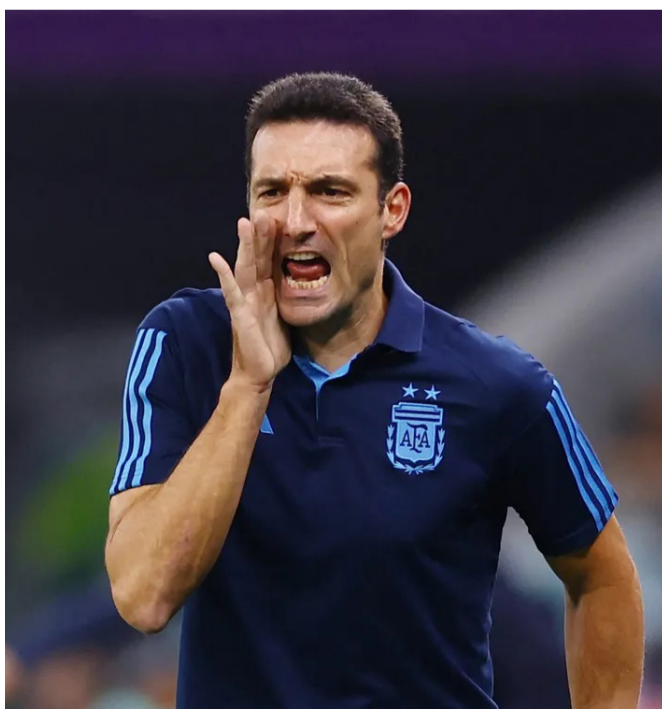
Lionel Scaloni, técnico da Argentina, no jogo contra a Austrália

A comissão técnica mantém o mistério e tem testado formações diferentes, com possíveis retornos e novidades na equipe. O desenho pode variar entre 5-3-2, 4-4-2 e 4-3-3. Tudo dependerá das condições de Rodrigo de Paul e Ángel Di María, que serão monitorados nos dois próximos dias.