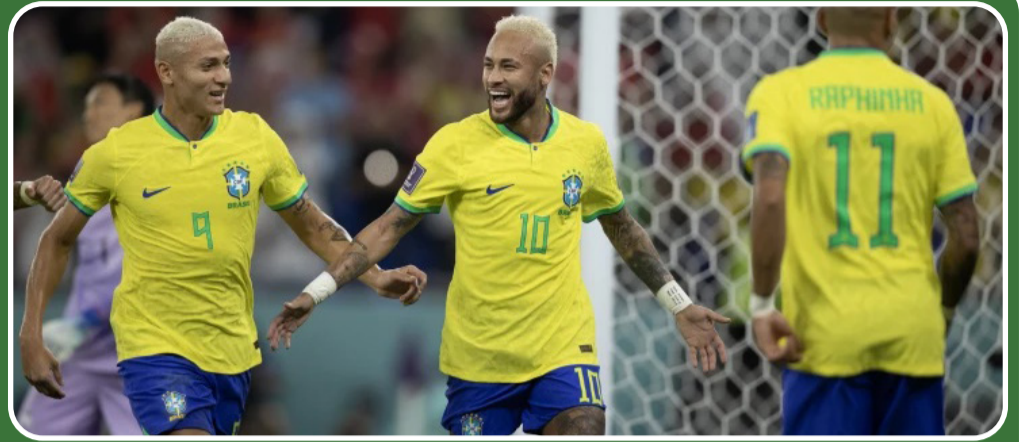
A Seleção Brasileira continua firme na briga pelo hexa na Copa do Mundo.

Marrocos (que disputa pela primeira vez as quartas de um Mundial) e Portugal jogam, a partir das 12h, no Estádio Al Thumama em busca de uma vaga nas semifinais. Quatro horas mais tarde será a vez de Inglaterra e França fecharem as quartas de final no Estádio de Al Bayt.