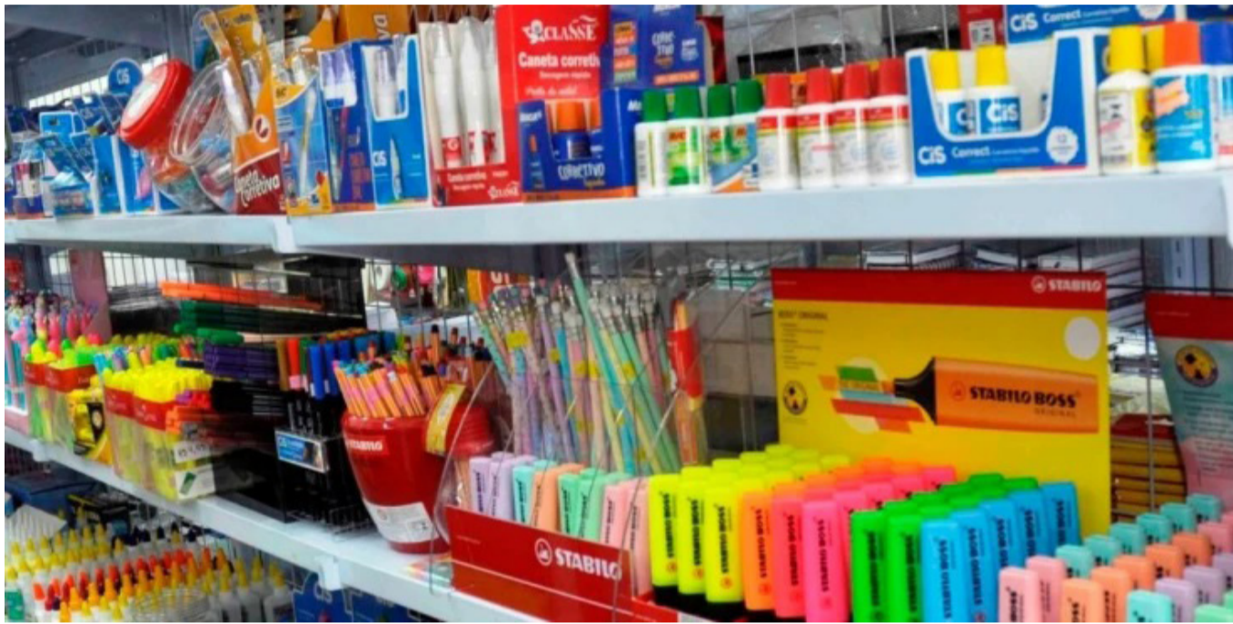
O órgão informa que os itens foram pesquisados em quatro estabelecimentos diferentes, de 13 a 16 de janeiro de 2023.

A agenda escolar, da marca DAC, atingiu variação de 99,73%, com maior preço de R$ 59,90, em uma livraria, e menor preço de R$ 29,99, em super-