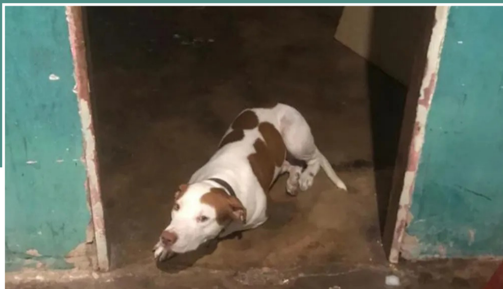
O bebê estava somente na companhia desse cachorro

Um bebê de um ano e oito meses foi resgatado por um vizinho após ter sido deixado em casa sozinho com um cachorro da raça pitbull, nessa segunda (16), no município de Santa Inês.