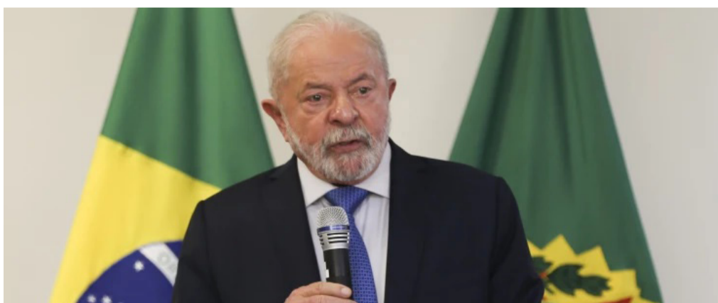
Carta em outubro de 2020 diz que o aborto não deve ser usado como método de planejamento familiar

O governo Lula retirou o Brasil da Declaração de Consenso de Genebra Sobre saúde da Mulher e o Fortalecimento da Família, assinada pela gestão de Jair Bolsonaro em outubro de 2020. O tratado é uma espécie de aliança internacional contra a prática do aborto.