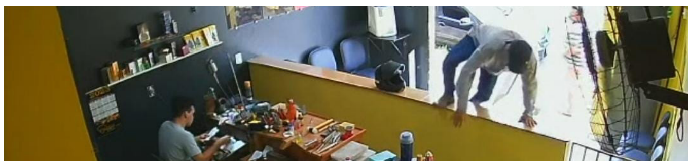
Câmera de segurança registrou todo o assalto