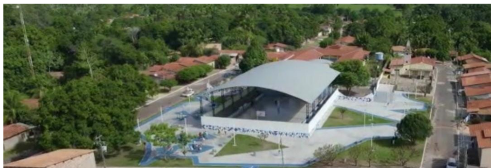
Praça do Juçaral do Capistrano foi inaugurada nesta segunda-feira

A programação oficial da Primeira Semana Crescer começou no último sábado, 14, às 16h com a inauguração da Arena Esportiva da Vila Militar, mais um incentivo de valorização do esporte no município. Até o próximo dia 20, a