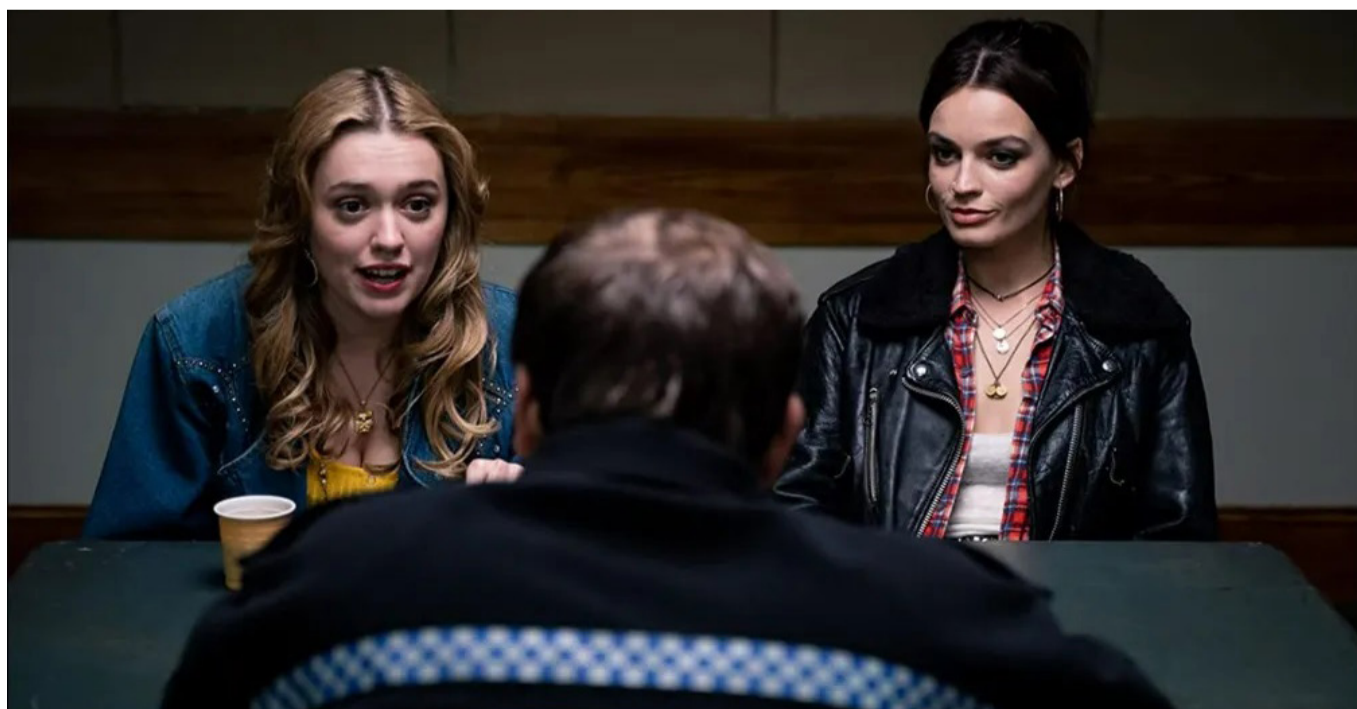
Aimee Lou Wood e Emma Mackey, atrizes do elenco da série "Sex Education"

• Sequências aguardadas: 'Creed 3', 'John Wick 4 - Baba Yaga', 'Veloze e furiosos 10', 'Indiana Jones e o chamado do destino', 'Duna - Parte 2'