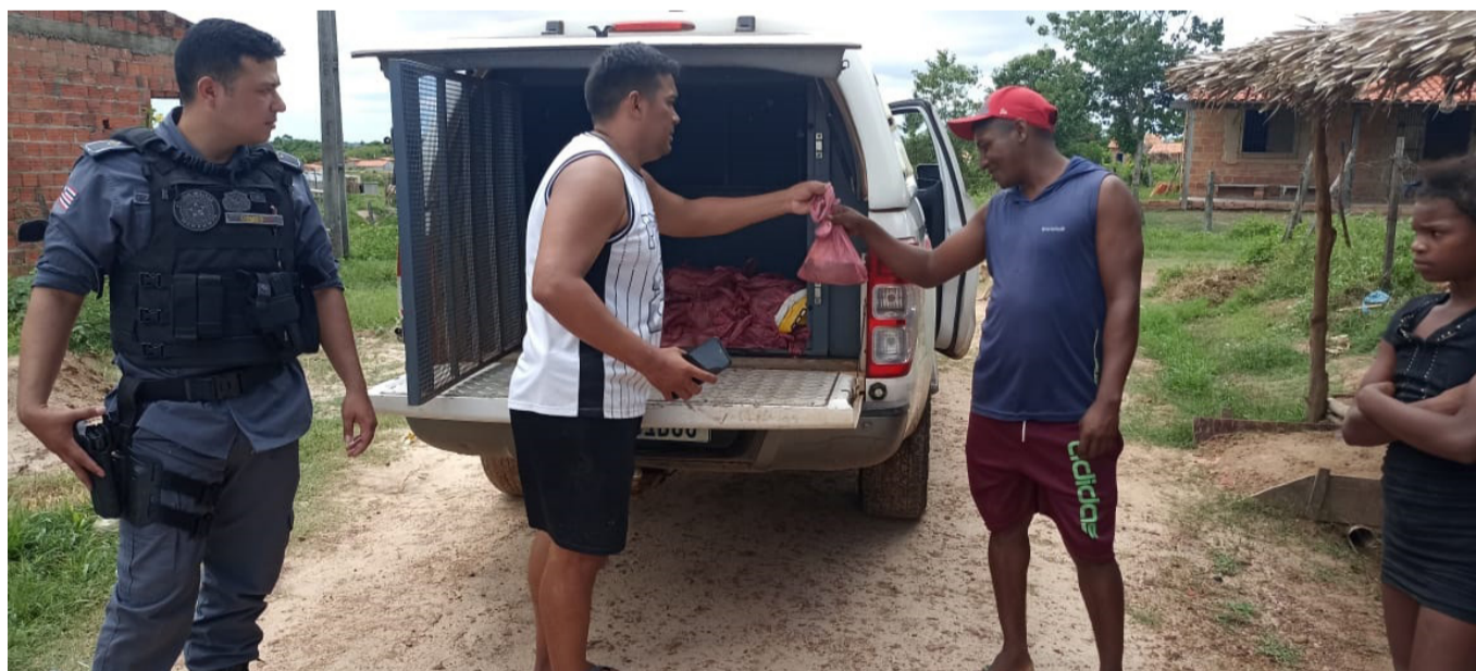
Pescado apreendido foi doado a famílias do bairro Aline Salgado

O local de armazenamento do pescado estava impróprio. O material apreendido foi distribuído para a população em vulnerabilidade social no Bairro Aline Salgado, Pindaré Mirim.