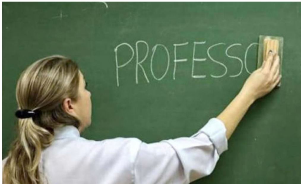
Portaria foi assinada pelo ministro da Educação, Camilo Santana.

O piso nacional dos professores subirá para R$ 4.420,55 em 2023, um reajuste de 15% em relação ao piso do ano passado, que era de R$ 3.845,63. A portaria com o novo valor foi assinada nessa segunda-feira (16) à noite pelo ministro da Educação, Camilo Santana.