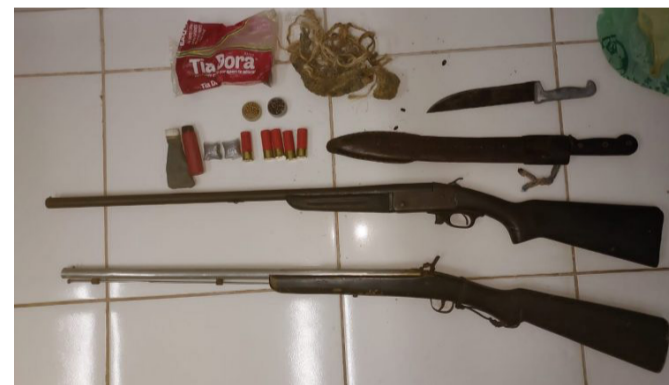
Objetos apreendidos durante cumprimento de mandando.

Após os procedimentos de praxe o suspeito será encaminhado ao sistema prisional, onde permanecerá a disposição do Poder Judiciário.