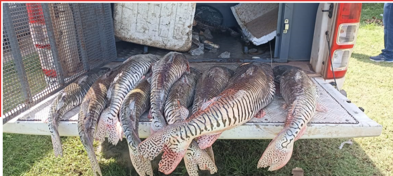
Vários peixes da espécie Surubim foram apreendidos durante a operação

Na manhã de segunda-feira, 16, a Polícia Militar deu início a operação de fiscalização e combate ao crime ambiental de pesca predatória e comercialização de pescados no período de defeso no Rio Pindaré.