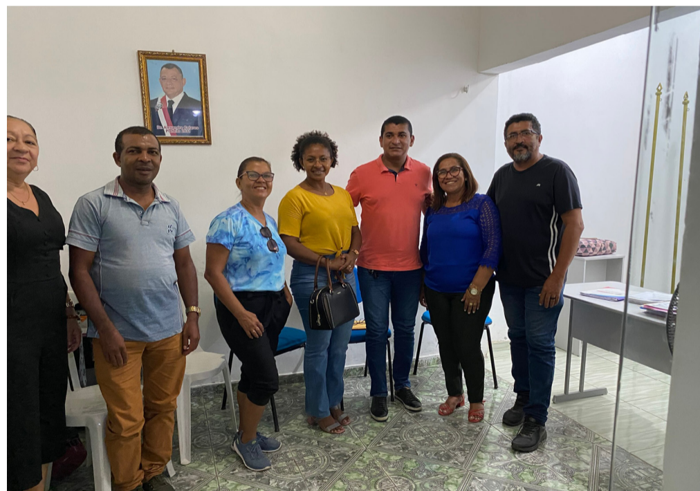
Núcleo do Sinproesemma ao lado da secretária de educação de Pindaré Mirim

Assim analisamos que a nossa luta no ano de 2022 foi positiva.