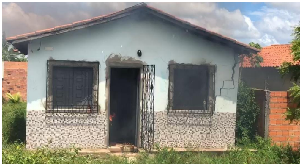
Imóvel ficou parcialmente destruído

A Polícia Militar foi chamada e o morador foi encaminhado à delegacia.