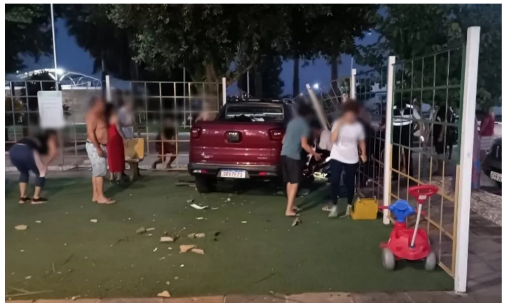
Motorista perdeu o controle do veículo e invadiu o playground do condomínio

A mãe da vítima teve uma fratura na mão, outras duas crianças tiveram escoriações e uma adolescente de 15 anos teve cortes na cabeça e na perna. Os feridos foram socorridos por uma ambulância do Samu e encaminhados para um hospital da região. Todos já foram liberados.