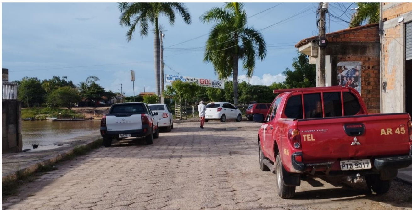
Os bares da orla do cais vão funcionar normalmente

Na tarde desta terça-feira, 24, o Corpo de Bombeiros juntamente com a Defesa Civil Municipal e direção do Departamento de Turismo de Pindaré Mirim fizeram um isolamento preventivo do calçadão do Cais da cidade.