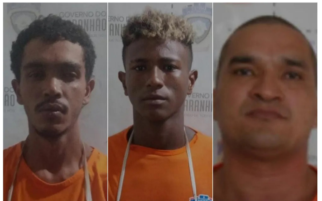
Fotos dos fugitivos foram divulgadas para ajudar na localização

Em nota, a Secretaria de Administração Penitenciária (SEAP) disse que todas as medidas legais cabíveis foram tomadas pelas autoridades para localizar os fugitivos. A secretaria afirmou, ainda, que forças policiais seguem realizando buscas na região na tentativa de recapturá-los.