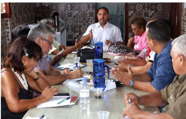
Direção do Sinproesemma discute sobre a Campanha Salarial 2023 em reunião na sede do sindicato

“E ficou assim todos os anos, o costume de esperar o MEC anunciar. A importância do anúncio é para quebrar a resistência dos prefeitos e governadores para reajustar o piso. Como nós estamos já na segunda quinzena de janeiro, precisamos ga-