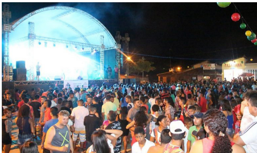
Serão quatro dias de muita diversão na Praça Governador José Sarney