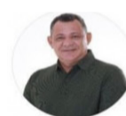
Prefeito Alexandre Colares @dr_alexandre_

Pessoal, tenho acompanhado a situação do nosso Cais e já estou em busca de soluções.