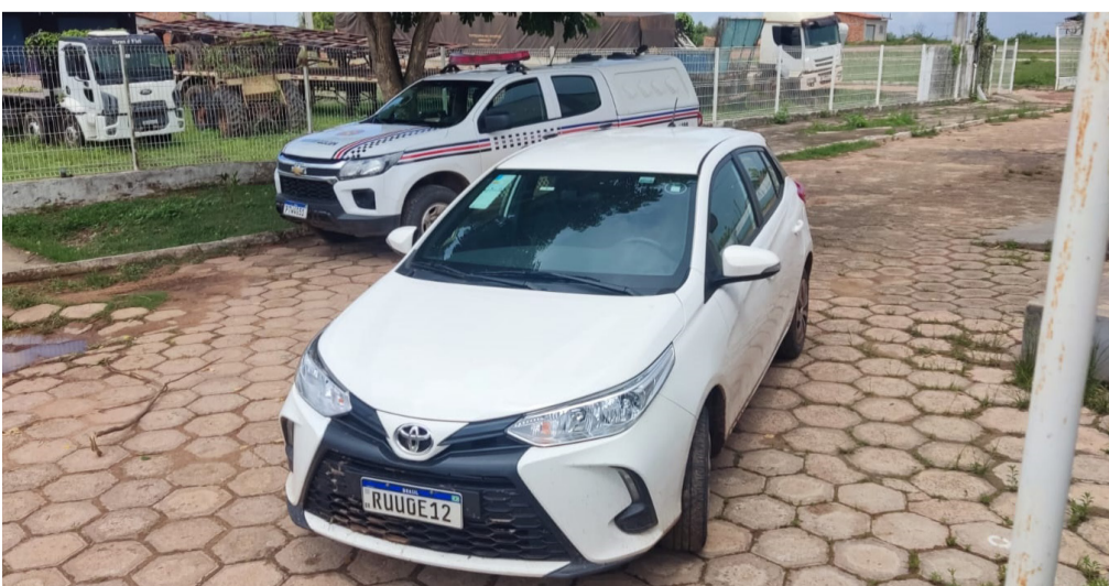
Veículo foi encontrado na zona rural do município

Agora a Polícia Civil vai investigar o caso.