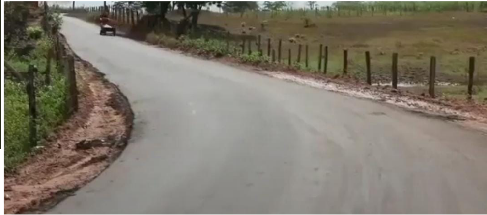
Em um dos assaltos três pessoas ficaram feridas

Os moradores do povoado Areias, em Pindaré Mirim, estão vivendo momentos de terror com uma onda de assaltos e roubos de motocicletas, principalmente na estrada que dá acesso a comunidade.