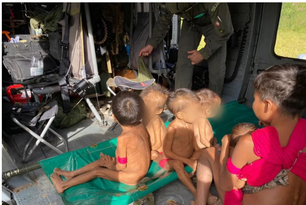
Crianças Yanomami resgatadas neste domingo, 22 de janeiro de 2023

As equipes estão na reserva desde o dia 16 de janeiro