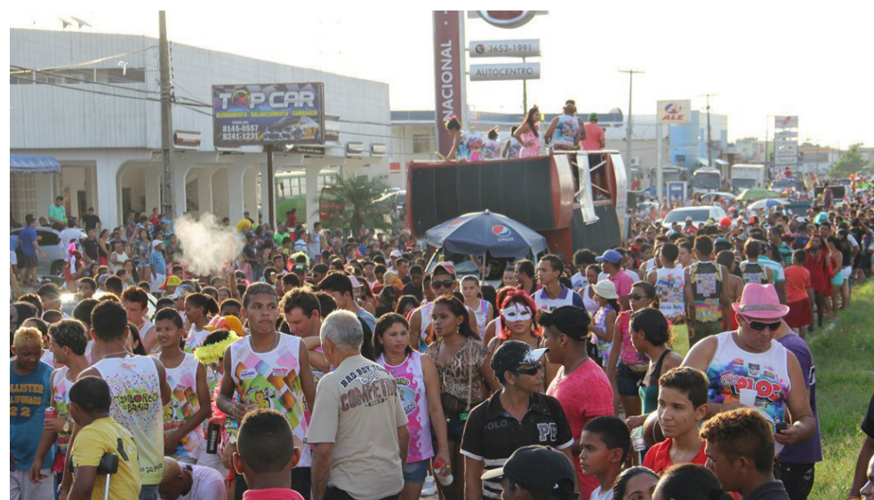
Arrastão Ponta da Linha deve bater recorde de foliões de Santa Inês e da região