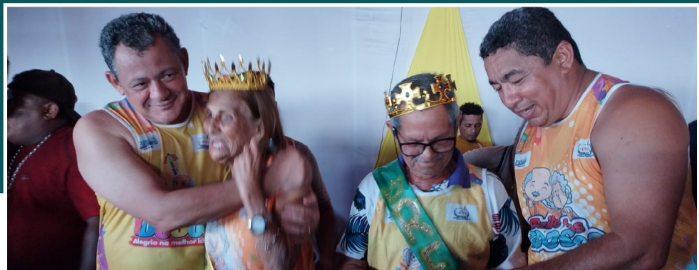
Durante o Baile dos Idosos foi escolhido o Rei e Rainha do evento