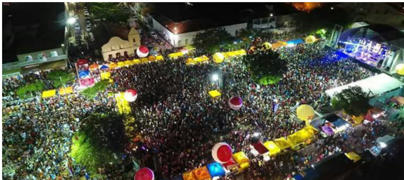
Arquivo/Carnaval de Pindaré Mirim

21 atrações irão animar os quatro dias de folia no Carnaval de Pindaré Mirim que já começa hoje (18). Uma grande estrutura de som, luz, palco, camarote e decoração temática já está montada na área da folia.