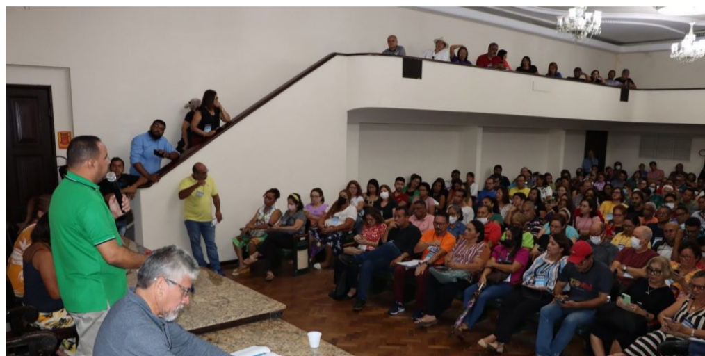
Categoria cobra reajuste salarial da ordem de 14,95%

Durante as assembleias a categoria deliberou sobre o movimento paredista dos trabalhadores em edu-