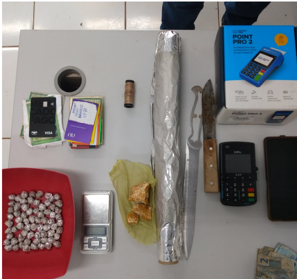
A operação "FIM DE FESTA" teve como objetivo visando combater o tráfico de drogas na cidade de São João do Carú

A Polícia Civil, com apoio da Polícia Militar, deflagrou nas primeiras horas de hoje (17) a operação "FIM DE FESTA" visando combater o tráfico de drogas na cidade de São João do Carú.