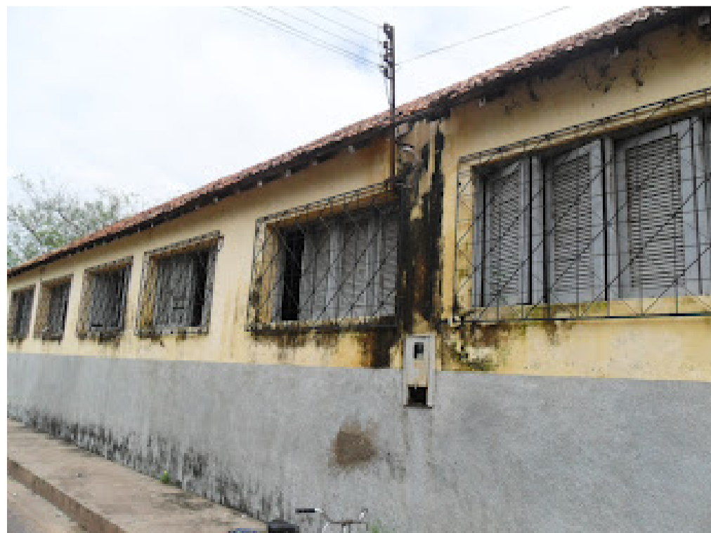
Fachada da escola onde o crime aconteceu

Após as comunicações de praxe, o indivíduo será encaminhado a Unidade Prisional de Santa Inês.