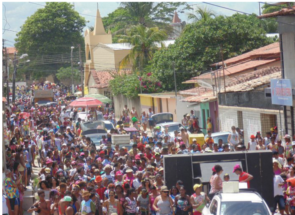
Essa será a 32ª edição do Arrastão do Paruru

Milhares de pessoas devem participar da 32ª edição do Arrastão do Paruru nesta segunda-feira de carnaval, 20 de fevereiro. A expectativa dessa edição é superar a marca de 30 mil foliões.