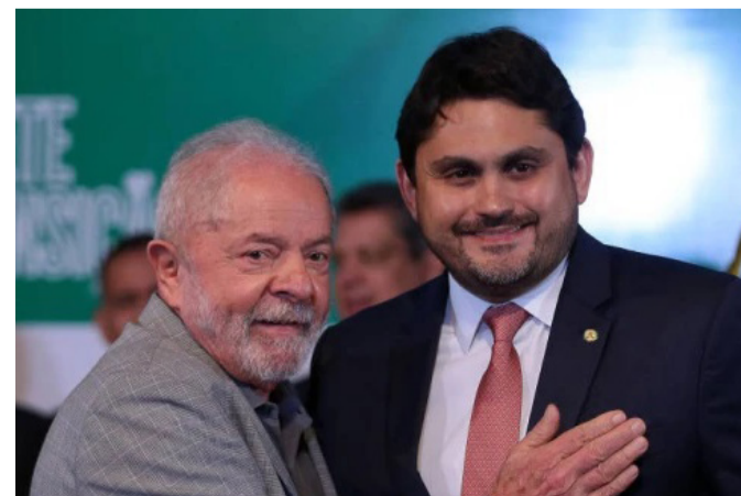
Lula diz que dará presunção da inocência a auxiliares denunciados (Divulgação/MCom)

O presidente condicionou a eventual demissão de ministros a uma “análise interna” de cada caso pela Controladoria-Geral da União (CGU). “Nós vamos ver internamente, através da CGU, para saber se tem procedência a denúncia. Se tiver procedência a denúncia, o ministro será afastado. Se não tiver procedência, segundo a CGU, vamos dizer que não tem procedência”, declarou.