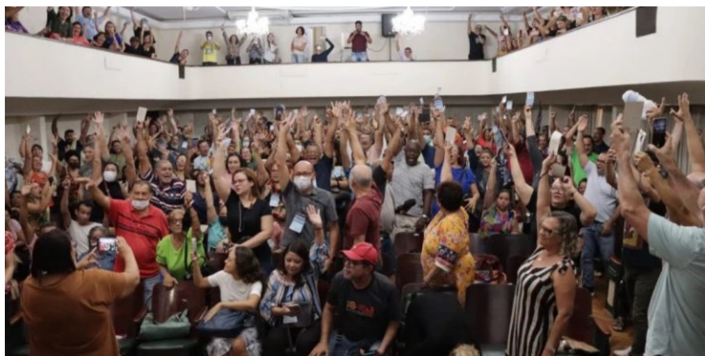
Assembleia final dos professores, realizada em São Luís

O Sinproesemma encerrou nesta quinta-feira, 16, em São Luís, o ciclo de assembleias gerais realizadas nas 19 regionais da entidade sindical.