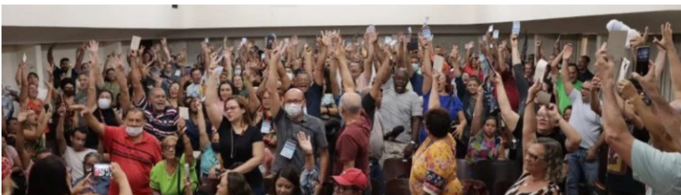
Professores da rede estadual decidiram iniciar greve na última segunda-feira