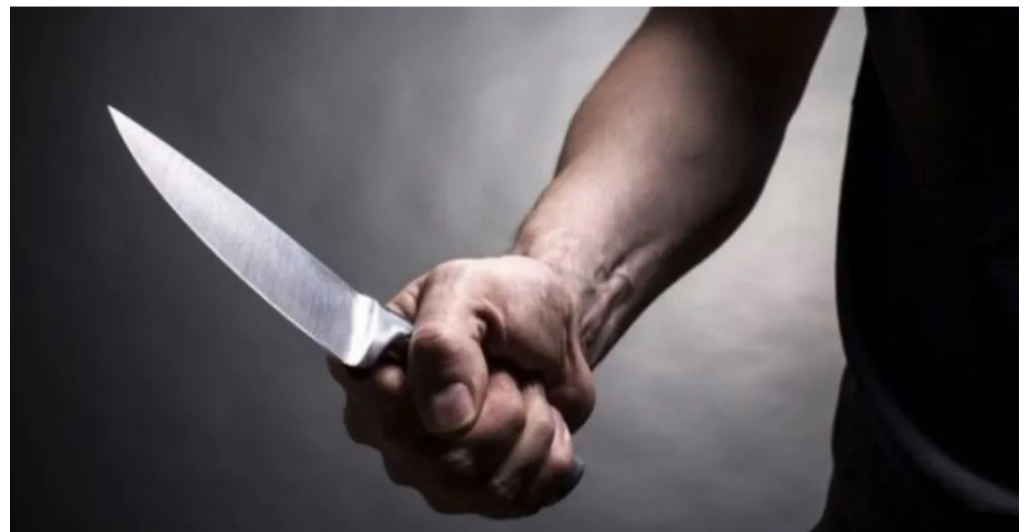
Vítima foi morta a golpes de faca.

A Polícia Civil do Maranhão (PC-MA), deu cumprimento a um mandado de prisão temporária, nesta quarta-feira (1º) contra um homem suspeito de praticar um homicídio qualificado no bairro Vila Alexandre Tavares, em São Luís. O crime foi registrado em dezembro do ano passado e teve como vítima uma pessoa com deficiência.