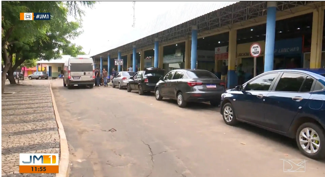
Um dos casos foi próximo ao terminal rodoviário.

Na noite da última sexta-feira (24), dois assassinatos e uma tentativa de homicídio foram registradas em Santa Inês.