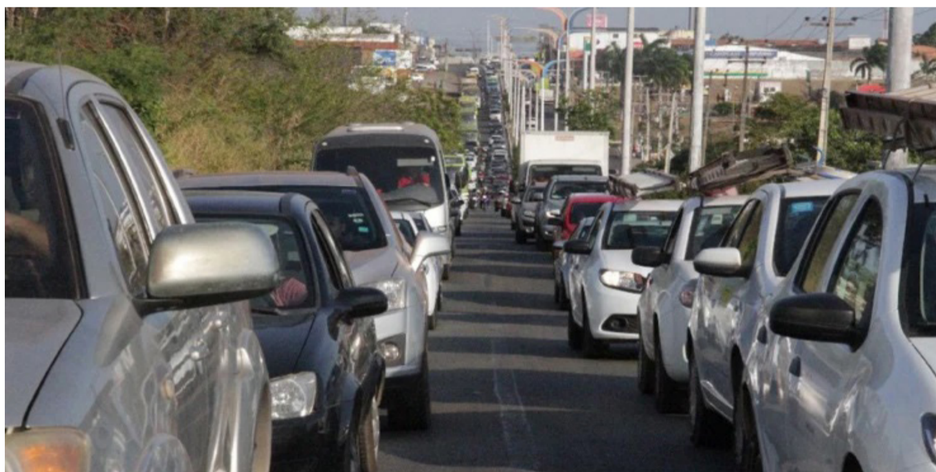
A consulta dos valores por modelo de veículo pode ser feita na página do IPVA.

O prazo para pagamento do IPVA 2023 foi prorrogado até o dia 3 de março, com 15% de desconto à vista. A nova data foi anunciada pelo governador do Maranhão, Carlos Brandão, em redes sociais.