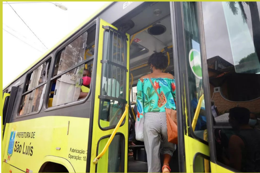
Reajuste das passagens dos ônibus do transporte coletivo de São Luís já estão em vigor; aumento foi de R$ 0,20

Uma Ação Civil Pública (ACP) foi ajuizada pelo Instituto de Promoção e Defesa do Cidadão e Consumidor do Maranhão (Procon-MA) para reduzir o valor das passagens de ônibus em São Luís, que foram reajustadas em R$ 0,30, no dia 19 de fevereiro. A ação segue em apreciação do judiciário, que nesta semana abriu prazo para respostas da Prefeitura de São Luís.