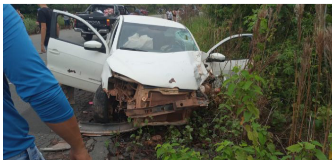
O carro ficou bastante destruído, porém os dispositivos de segurança foram acionados