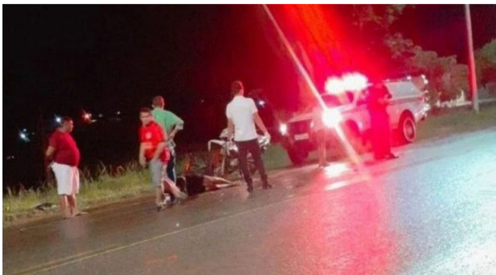
Uma das vítimas ficou em estado grave

A terça-feira (28) terminou com um acidente grave em Bom Jardim. A batida entre duas motocicletas deixou três pessoas feridas, uma delas em estado grave.