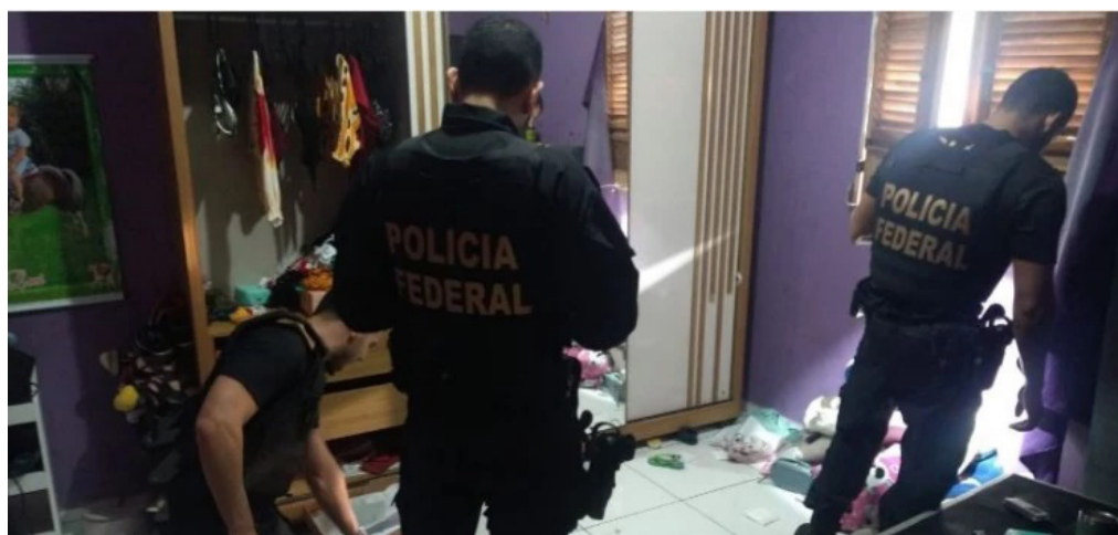
No total, 22 policiais federais cumpriram sete mandados judiciais.

O nome da operação é uma expressão em latim, significando maternidade. Trata-se de uma referência a tipologia da fraude perpetrada.