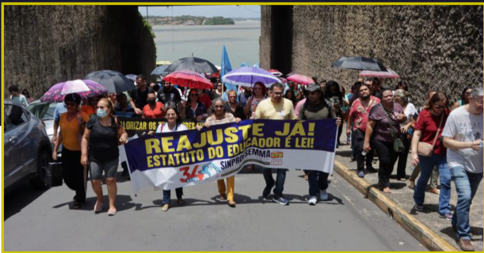
Os educadores foram às ruas onde defenderam o reajuste do piso da categoria

Os trabalhadores em educação do Maranhão deram início na segunda-feira, 27, a semana de paralisação em busca dos direitos da categoria que estão sendo negados pelo governo do Estado.