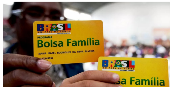
Foto: Cartão do Bolsa Família