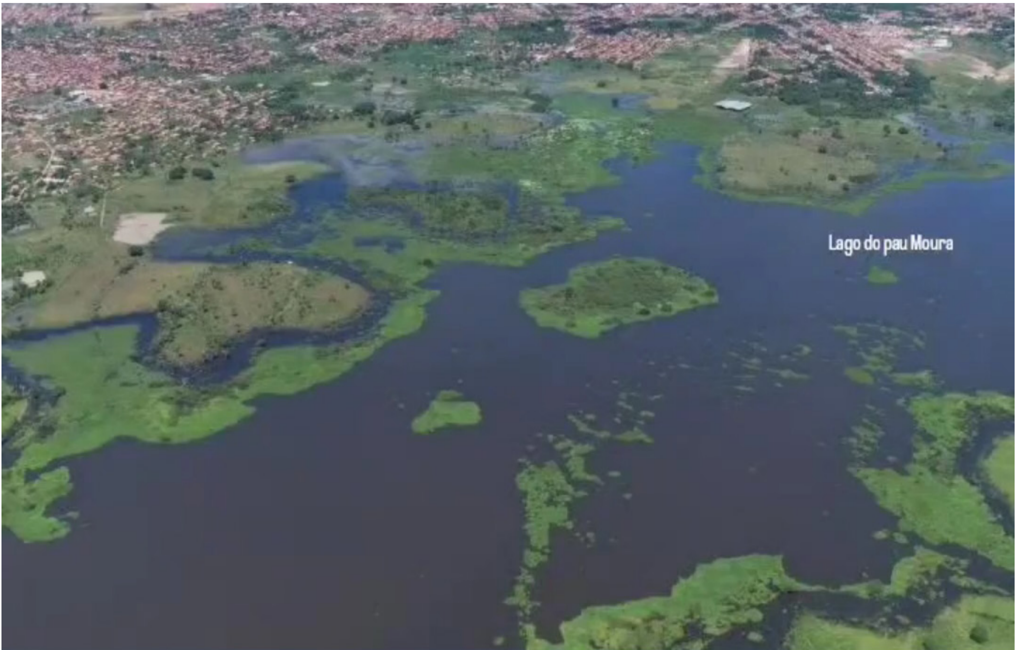
Lago do pau Moura