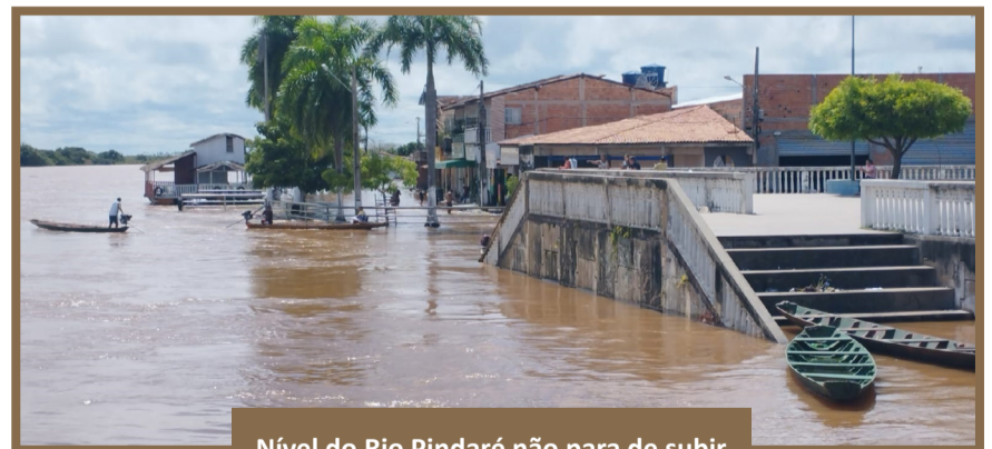
Nível do Rio Pindaré não para de subir

No final da tarde o serviço paliativo foi finalizado.