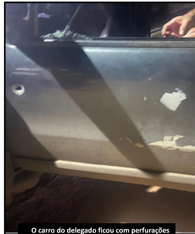
O carro do delegado ficou com perfurações de balas na frente e na lateral

A Polícia Civil trabalha, inicialmente, com a hipótese que o delegado foi vítima de um assalto. Equipes da Superintendência Estadual de Investigações Criminais (Seic) e a Superintendência de Polícia Civil do Interior (SPCI) estiveram no local para dar suporte às investigações do crime.