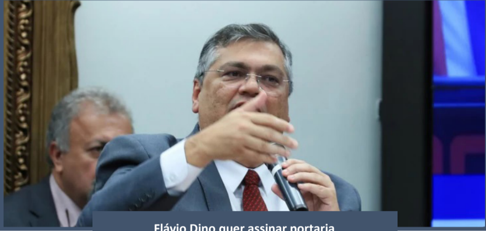
Flávio Dino quer assinar portaria nesta semana

O Governo Federal, por meio do Ministério da Justiça e Segurança Pública quer se antecipar ao Congresso Nacional e já prepara uma portaria que vai estabelecer critérios para a retirada de conteúdos que disseminam a violência e que podem influenciar no ataque a escolas no país.