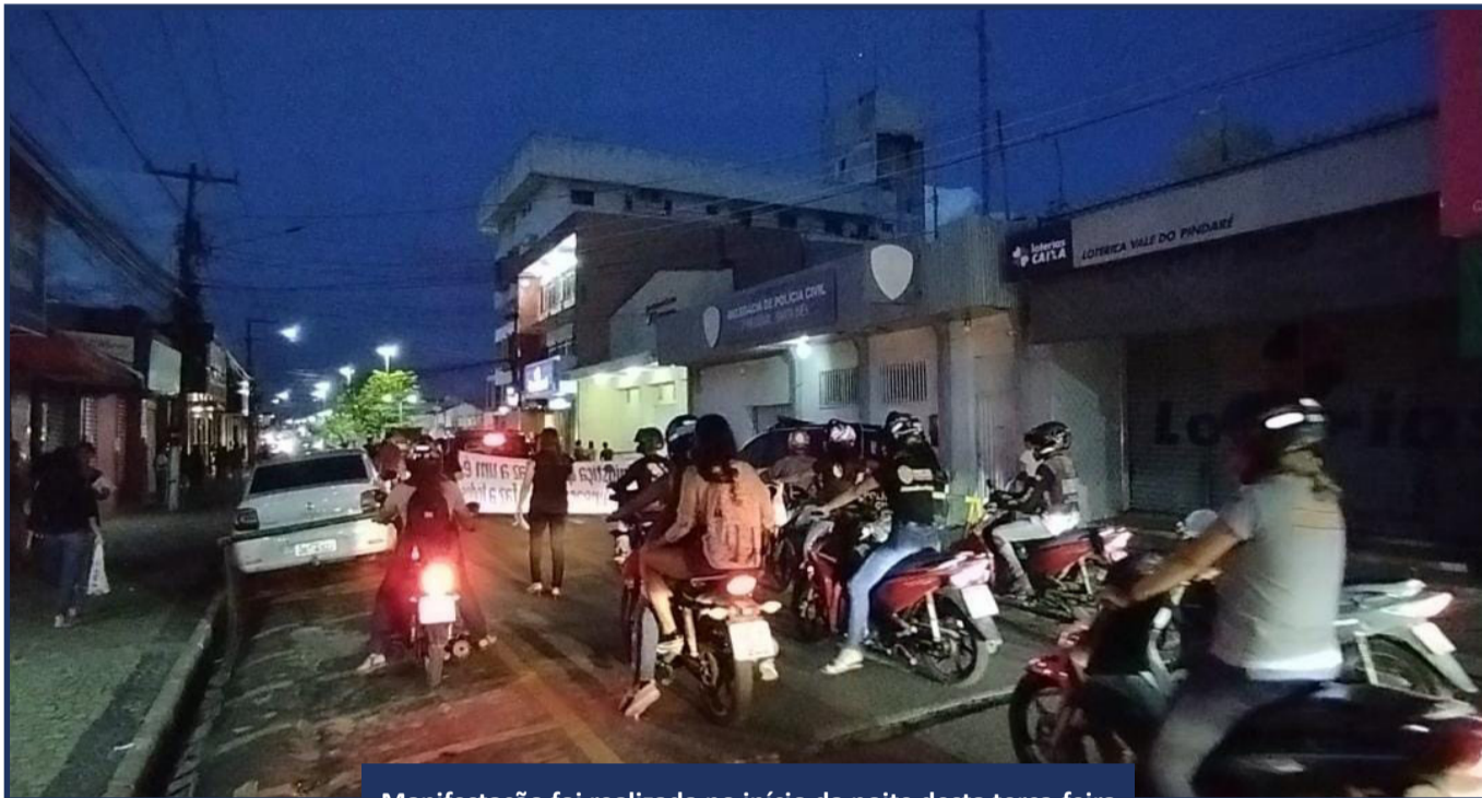
Manifestação foi realizada no início da noite desta terça-feira

A delegada falou ainda que as investigações estão na fase de conclusão.