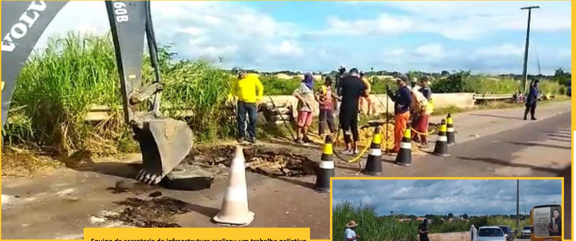
Equipe da secretaria de infraestrutura realizou um trabalho paliativo