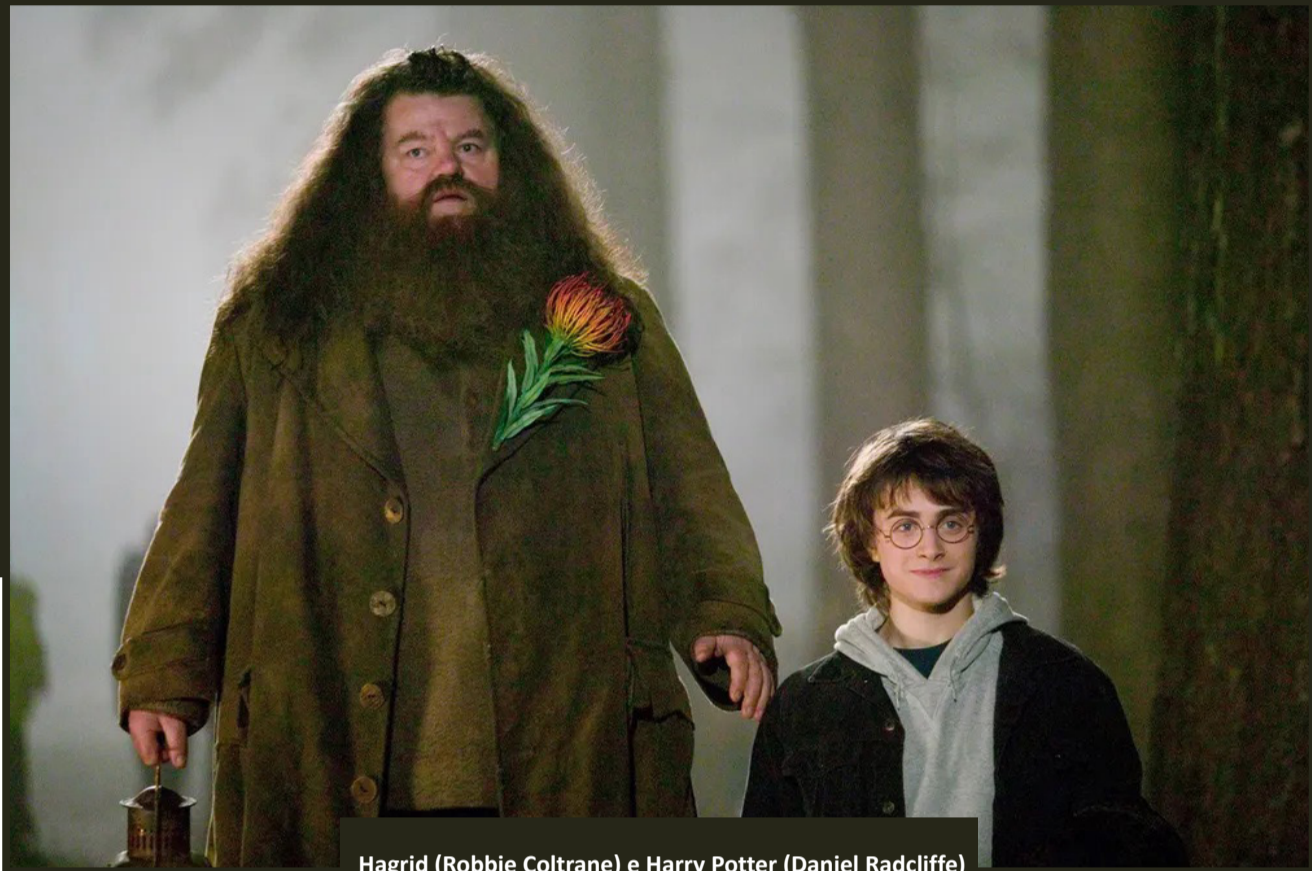
Hagrid (Robbie Coltrane) e Harry Potter (Daniel Radcliffe) em um dos filmes da franquia

A série inspirada nos livros de Harry Potter foi confirmada nesta quarta-feira (12). Será uma produção original da plataforma no Max, nome novo do serviço de streaming HBO Max, e terá novo elenco.