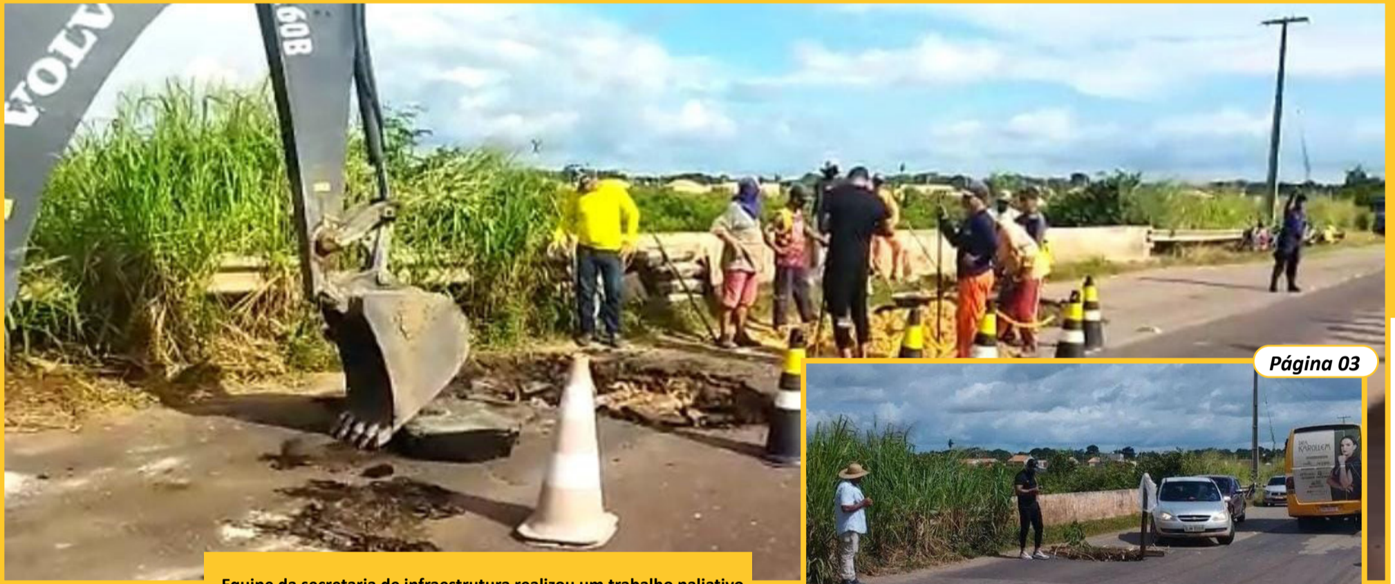
Equipe da secretaria de infraestrutura realizou um trabalho paliativo