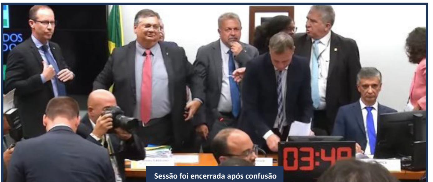
Sessão foi encerrada após confusão

Após o anúncio de que a reunião foi encerrada, a oposição entoou gritos de “fujão” para o ministro Flávio Dino.