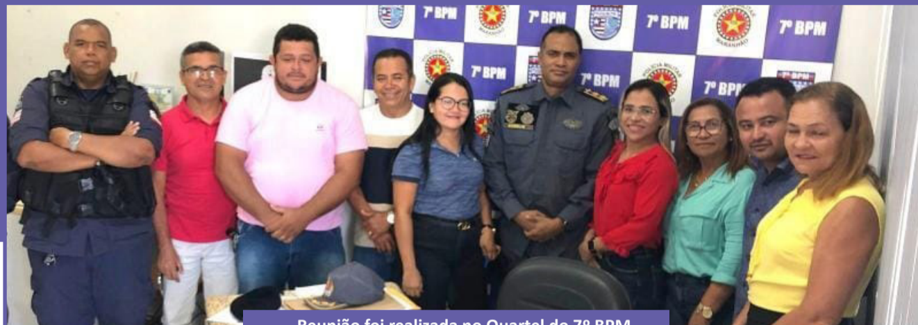
Reunião foi realizada no Quartel do 7º BPM

A Secretaria de Educação e Cultura de Pindaré Mirim promoveu nesta terça-feira, 11, uma reunião para tratar sobre a segurança nas escolas do município, tendo em vista os registros de violência em unidade de vários estados brasileiros.