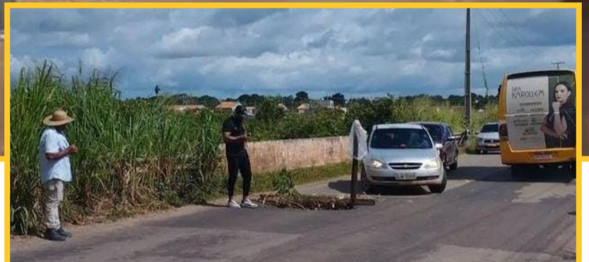
Situação preocupou quem precisa passar pelo local diariamente