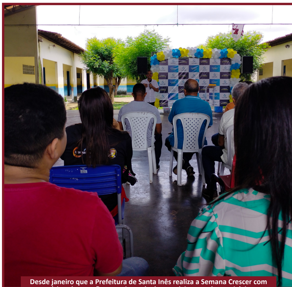
Desde janeiro que a Prefeitura de Santa Inês realiza a Semana Crescer com várias obras, ações e projetos de desenvolvimento do município

A Semana Crescer vai até o próximo sábado, 15. Na sexta-feira, 14, será lançado o Projeto Ecoponto de sustentabilidade. No sábado, será inaugurado um polo no Bairro Vila Adelaide Cabral.