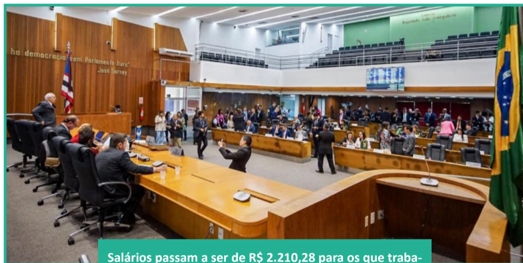
Salários passam a ser de R$ 2.210,28 para os que trabalham no regime de 20 horas.

Na mensagem governamental de encaminhamento da matéria à Assembleia, o governador Carlos Brandão (PSB) justifica que a proposição tem por finalidade alterar a legislação vigente para revalidar o compromisso da atual gestão com a valorização dos servidores da educação, essenciais para a sociedade enquanto preceptores das novas gerações. "E para a evolução do desempenho e da qualidade dos serviços prestado à população escolar do Maranhão", acrescentou o governador.