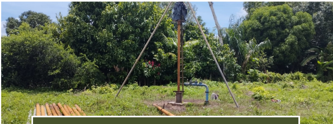
Poço que está parada e prejudicando milhares de pessoas em Pindaré Mirim

Boa parte da cidade de Pindaré Mirim está com problema no abastecimento de água há cerca de duas semanas e como foram pegos de surpresa muitos não conseguiram reservar água.