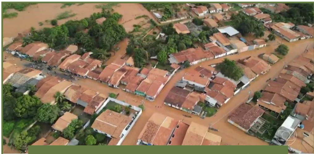
Chuvas causam destruição no Maranhão