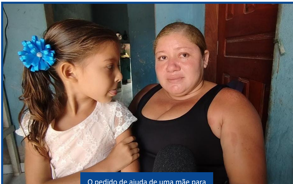
O pedido de ajuda de uma mãe para evitar que a filha perca a visão