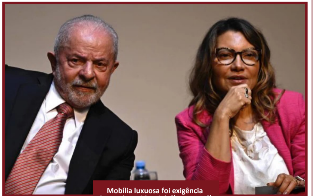
Mobília luxuosa foi exigência do casal presidencial.

A notícia das compras foi dada em primeira-mão pela Folha de São Paulo.