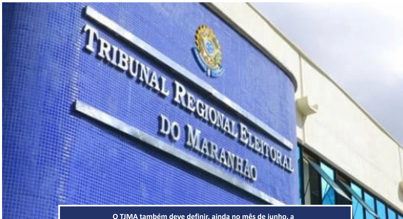
O TJMA também deve definir, ainda no mês de junho, a lista tríplice a ser encaminhada ao governador do Maranhão, Carlos Brandão (PSB)

Os desembargadores do Tribunal de Justiça do Maranhão (TJMA) definiram, nesta quarta-feira (7), as listas tríplices a serem enviadas ao presidente Luiz Inácio Lula da Silva (PT) para nomeação de dois novos membros do Tribunal Regional Eleitoral do Maranhão (TRE-MA).