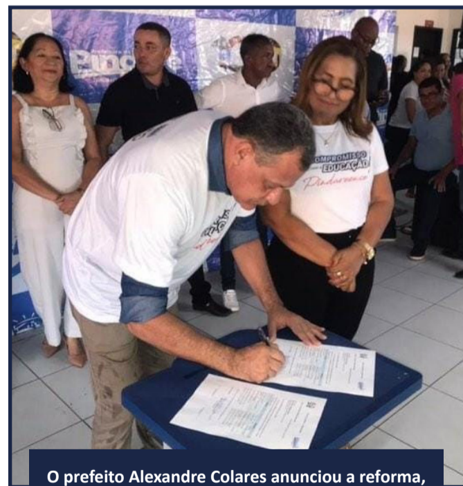
O prefeito Alexandre Colares anunciou a reforma, ampliação e climatização de 10 escolas municipais