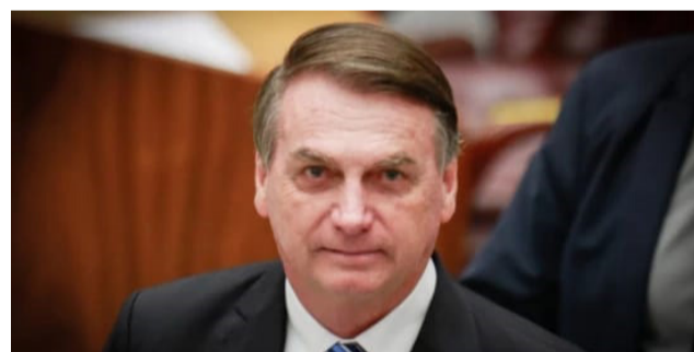
O Tribunal de Contas da União (TCU) aprovou, por unanimidade, as contas do governo do ex-presidente Jair Bolsonaro

Após o julgamento, o presidente do TCU, ministro Bruno Dantas, elogiou o relatório de Oliveira, destacando seu rigor técnico e apreço pela administração pública. O presidente da Corte também ressaltou que, durante o exercício de 2022, foram concedidos auxílios no país, como o auxílio gás no valor de R$ 1 bilhão, o auxílio caminhoneiro no valor de R$ 5,1 bilhões e o auxílio taxista no valor de R$ 2 bilhões, todos criados por emenda constitucional. Ele reforçou que "2023 será um ano de ajustes da nossa economia pública".