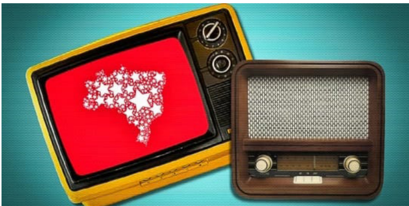
A medida deve complementar ações de comunicação, atualmente estruturadas basicamente em canais de redes sociais

"A comunicação por canal partidário específico possibilitaria a justa prestação de informação uma vez que os partidos políticos são indis-