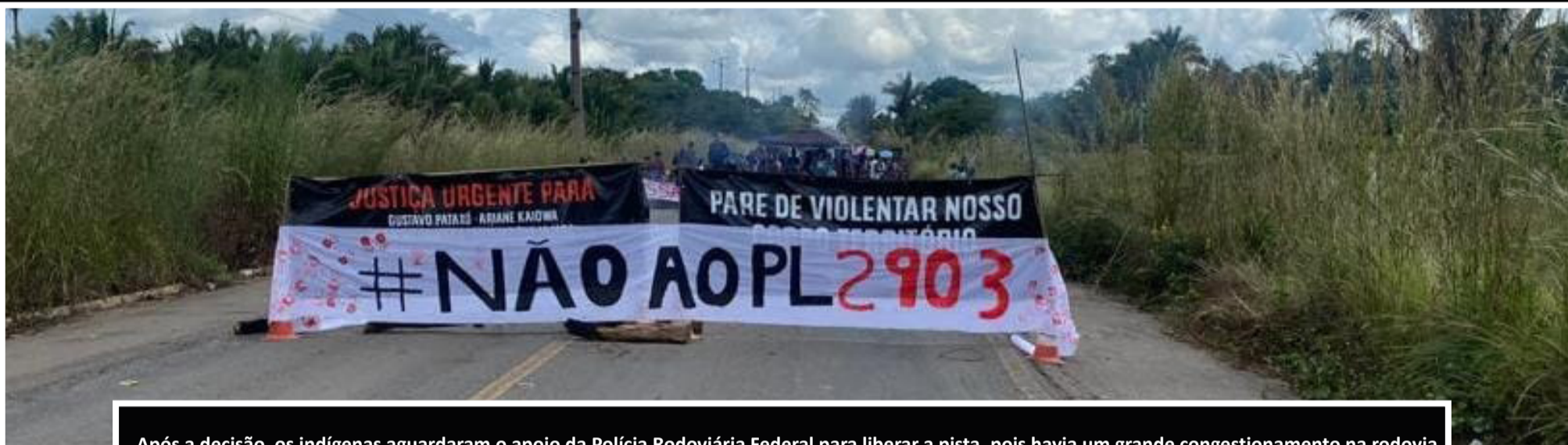
Após a decisão, os indígenas aguardaram o apoio da Polícia Rodoviária Federal para liberar a pista, pois havia um grande congestionamento na rodovia

Indígenas liberaram no início da noite desta segunda-feira, (7) a BR 316 após mais de 30 horas de interdição total da rodovia.