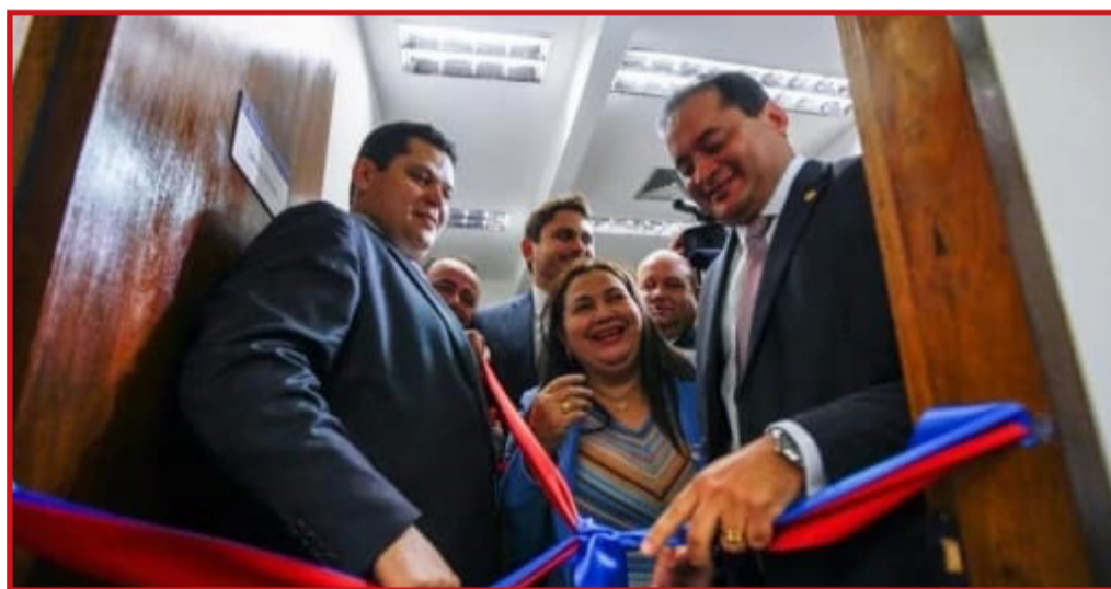
O ex-advogado do petista pode ocupar na Corte a vaga aberta após a aposentadoria do ministro Ricardo Lewandowski, em abril deste ano

O presidente da CCJ garante que nenhum nome fora desta lista assumirá a relatoria da sabatina de Zanin. O advogado precisa passar pelo crivo do Senado pra assumir a cadeira de ministro do Supremo. A expectativa do governo Lula é que a sabatina do indicado aconteça até 21 de junho.