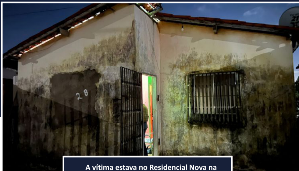
A vítima estava no Residencial Nova na mira de um terceiro criminoso, de 24 anos

Na tarde desta terça-feira (6), um homem foi raptado, nas proximidades do Mercado do Peixe, em São Luís. Depois, ele foi levado em um carro até o Residencial Nova Terra, em São José de Ribamar, na Grande São Luís, onde ficou em cárcere privado na mira de criminosos, que exigiam dinheiro a familiares para que a vítima fosse solta.