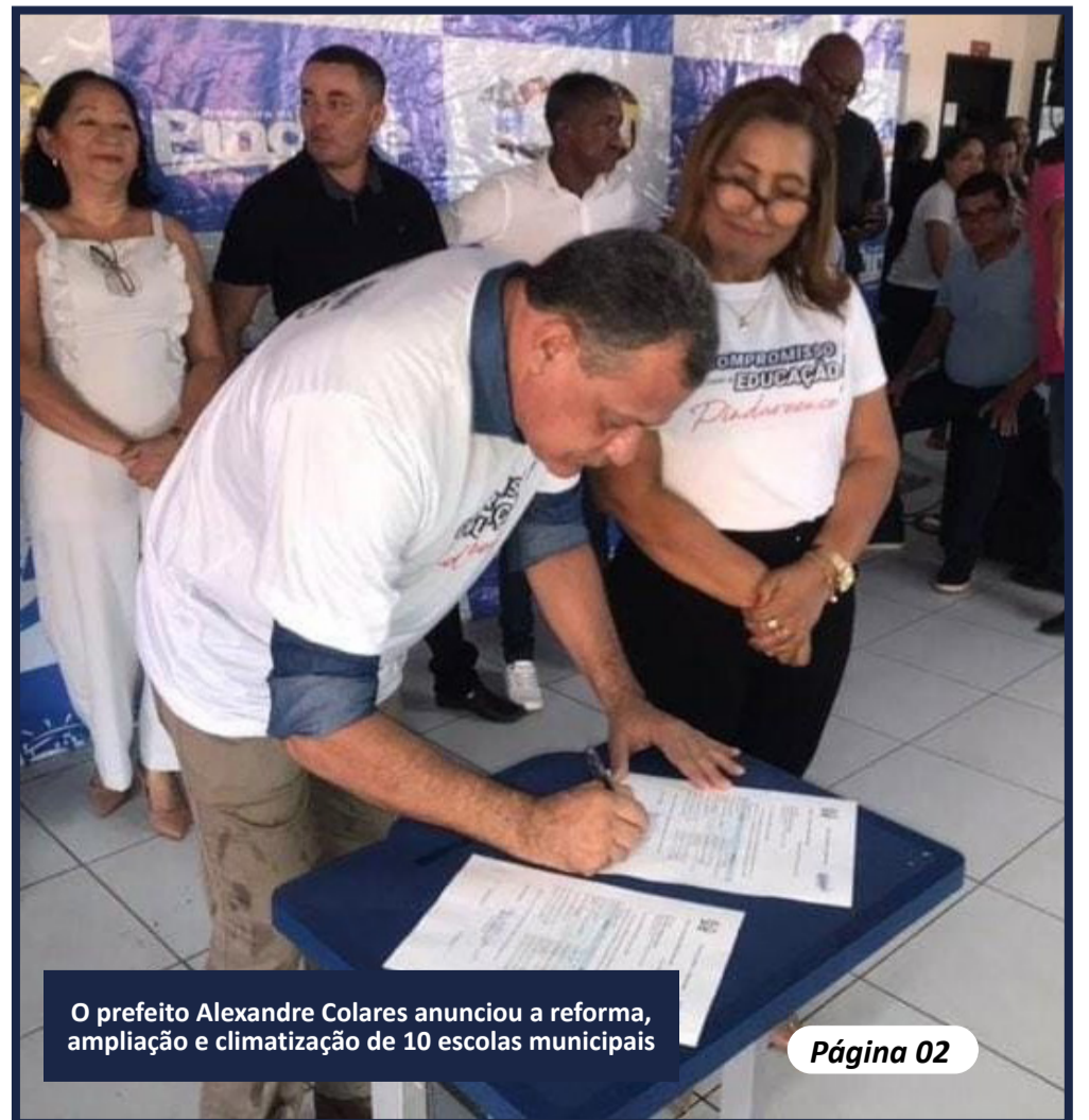
O prefeito Alexandre Colares anunciou a reforma, ampliação e climatização de 10 escolas municipais